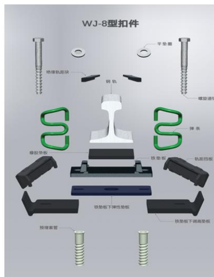
扣减系统散装图——以WJ-8型高铁扣件为例