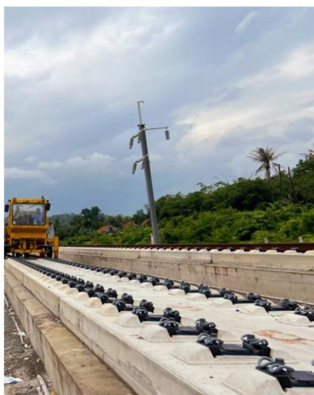
公司高铁扣件产品应用于雅万高铁现场情况