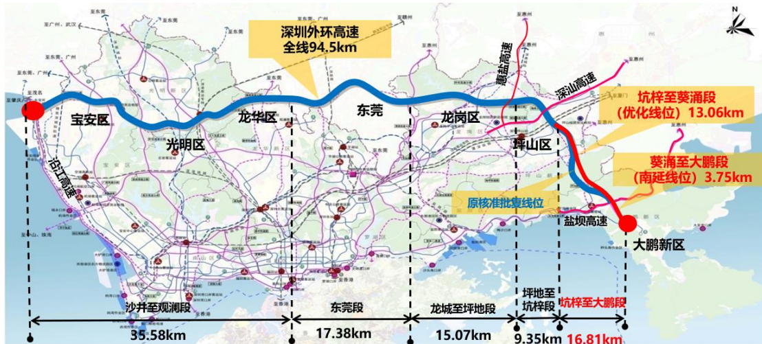
深圳外环高速地理位置示意图

坑梓至大鹏段包括坑梓至葵涌段及葵涌至大鹏段（南延线位）。其中，坑梓至葵涌段路线全长 13.07 公里，共设桥梁 7,417 米/10 座，隧道 5,088 米/1 座（以左右线平均计），桥隧总长 12,505 米，占路线长度的比例为 95.67%，互通式立交 4 处，匝道收费站 14 处。葵涌至大鹏段路线全长 3.74 公里，采用双向六车道高速公路标准，设置桥梁 195 米/1 座，隧道 3,280 米/1 座，互通式立交 1 处（大鹏互通），主线收费站 1 处，匝道收费站 2 处。