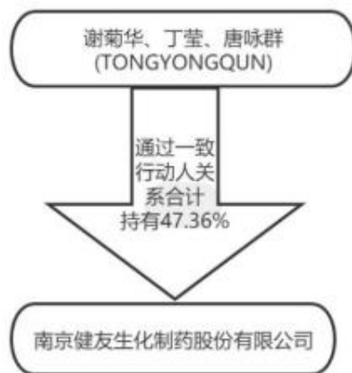
附件 1-1 截至 2022 年末南京健友生化制药股份有限公司 股权结构图