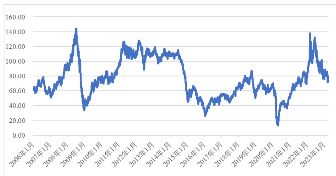
国际原油（英国北海布伦特）油价变动情况（单位：美元/桶）

随着世界经济形势的变化、石油开发投资规模波动等诸多因素的影响，本公司会面临石油天然气行业周期性波动，导致潜油泵电缆、连续油管、液压控制管等油服领域销售收入、经营业绩波动的风险。