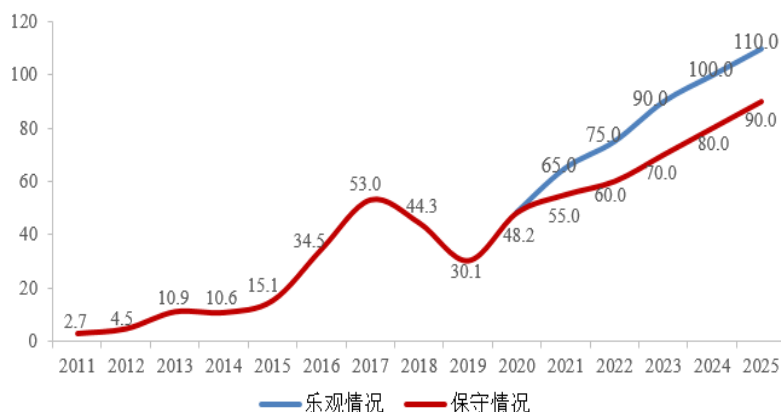
中国光伏装机容量预测（GW）

根据中国光伏行业协会的预测，2022-2025 年，乐观情况下，我国新增光伏装机容量合计为 395GW，而在全球范围内新增光伏装机容量预计为 1,145GW，光伏行业具有较为明确的发展前景。