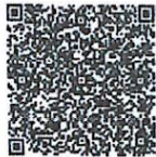
韩频的年检二维码

本证书经检验合格,继续有效一年。 This certificate is valid for another year after this renewal.