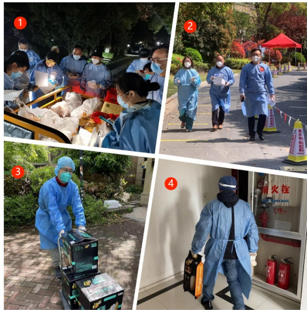
图为公司员工参加社区疫情防控志愿服务。