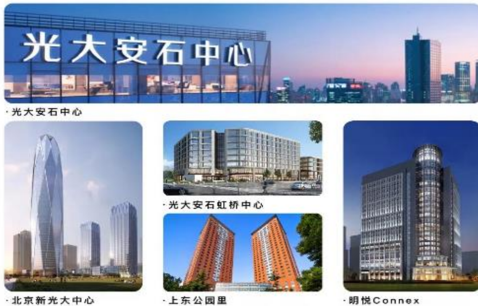
光大安石部分资管项目

券化等在内的多条成熟产品线，拥有项目并购整合、主动管理、跨境资本市场投资等全方位业务能力。截至 2022 年 12 月末，通过各种机会型、增值型基金，光大安石累计管理规模超过 1320 亿人民币，已成功退出超过 868 亿元投资、125 个项目。光大安石旗下自有商业品牌大融城，始终坚持以精细化管理及运营为核心，因地制宜地呈现各具特色的商业空间，致力于为不同年龄层的消费者带来新颖时尚、年轻潮流的购物体验。目前光大安石已在全国 9 个城市布局 24 座大融城，总管理规模超 280 万平方米，打造了 Art Park 大融城、IMIX PARK 大融城、奥莱大融城、文旅商业中心及大融汇五大产品条线。