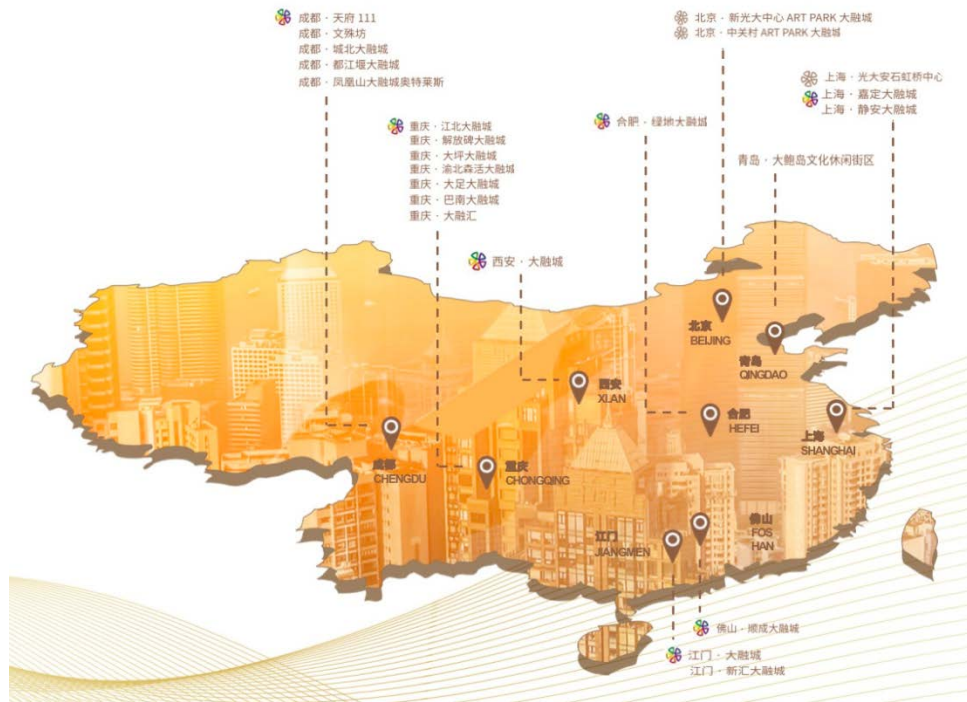
光大安石大融城城市布局

公司地产开发品牌在长三角具有较好的口碑和较强的竞争力，年开发能力超 100 万平方米。近年来，公司打造了一系列优质楼盘，多次获得“上海市优秀住宅金奖”、上海市节能省地型“四高”优秀小区、上海市建设工程“白玉兰奖”、上海市“园林杯优质工程金奖”等荣誉称号。