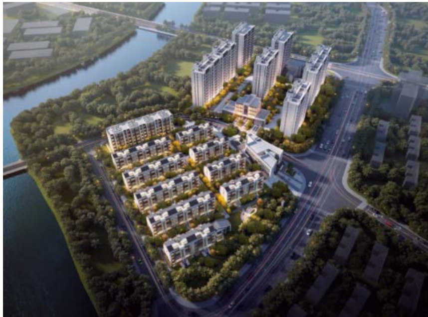
嘉宝·梦之春项目效果图