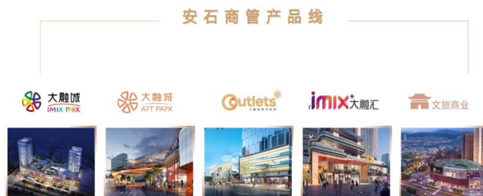
光大安石自有商业品牌系列