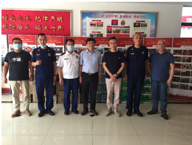
图为参加活动人员向嘉定消防救援支队“送清凉”。

公司为不断履行社会责任，构建和谐社会关系。在酷暑期间组织前往上海市消防救援总队嘉定支队，向消防指战员们送去夏日清凉慰问品，并与支队党政班子座谈交流。区消防救援支队在支持地方经济建设、保卫人民生命财产安全等方面做出了突出贡献，光大嘉宝的转型发展也离不开消防支队的大力支持和指导，双方加强交流，致力于共同为地方经济社会发展作出更大贡献。