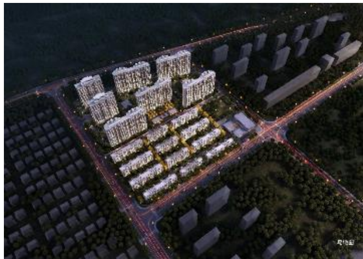
嘉宝·梦之晴项目效果图

嘉宝·梦之晴华庭项目位于上海市嘉定区安亭镇硕望路 188 弄。项目规划总用地面积 6.05 万平方米，总建筑面积 15.8 万平方米，地上计容总建筑面积 10.89 万平方米。