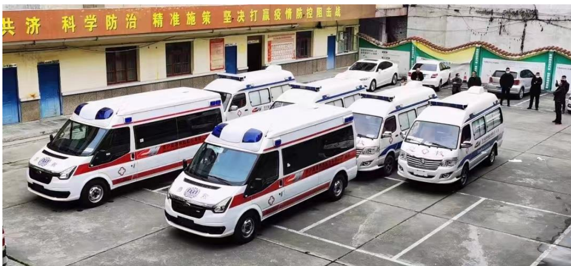
京沪高铁所捐赠医疗救护车