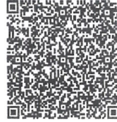
白莹莹的年度检验登记二维码.png

本证书经检验合格，继续有效一年。 This certificate is valid for another year after this renewal.