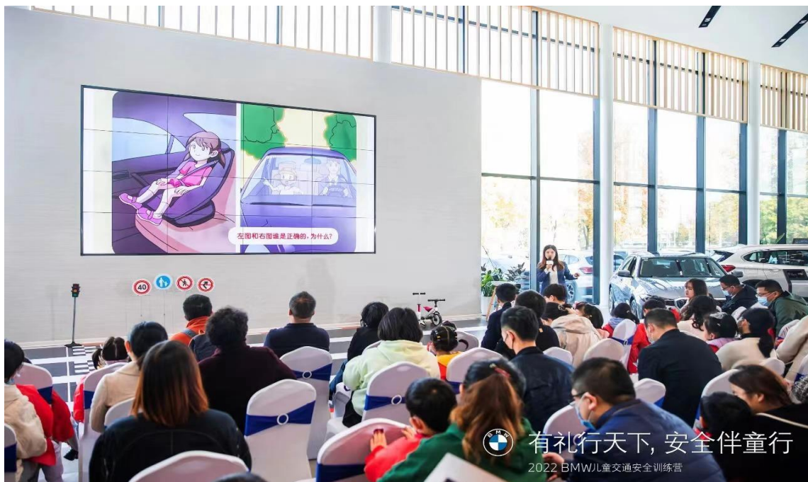
图为芜湖宝利盛开展车主讲堂活动