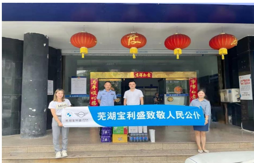
图为芜湖宝利盛在高温天气为一线干警送上清凉

2022年8月，为了致敬服务在一线的人民公仆，做好防暑降温工作，展现出“警民一家亲”，芜湖宝利盛开展了“高温送清凉”慰问活动，为在炎炎烈日下工作的人民公仆送去清凉和关怀。