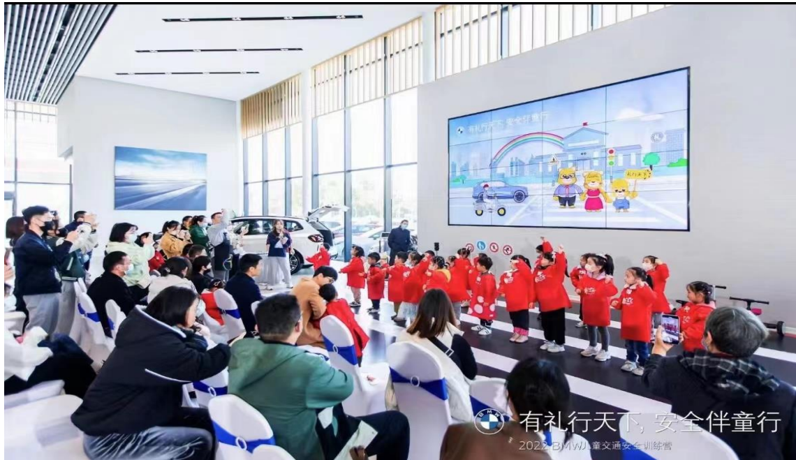
图为芜湖宝利盛开展儿童交通安全教育活动

芜湖宝利盛会在客户生日当天给客户发送祝福信息，邀请其来店免费领取生日礼品。在特殊节日以及天气，也会给客户送上关怀及祝福的信息。在售后方面，芜湖宝利盛不定期推出维修保养优惠套餐供客户选择，提醒客户到期保养。2022年芜湖宝利盛开展了爱车讲堂活动及儿童交通安全训练营活动，让安全意识从小扎根在孩子心中。