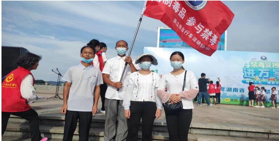
图为湖南申德房车营地公园参与禁毒宣传活动