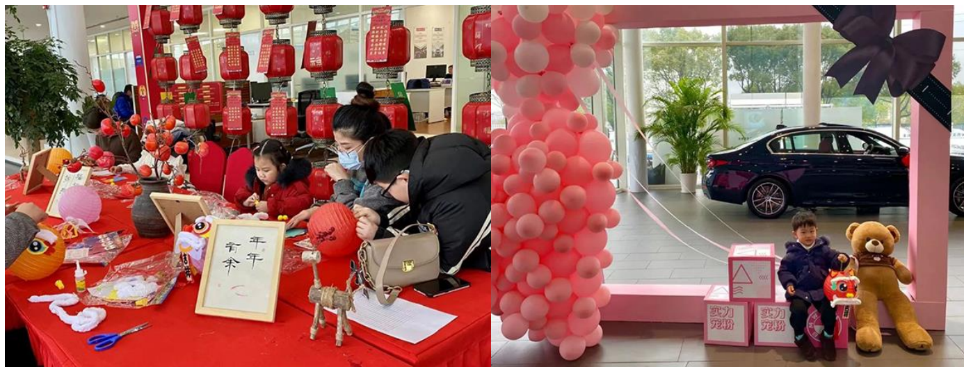
图为慈溪宝利丰元宵节特别活动

元宵节是中国传统节日，全国各地习俗不尽相同，其中吃汤圆，赏花灯，舞龙，舞狮子等是元宵节几项重要民间习俗。2022年2月12—13日，慈溪宝利丰为庆祝情人节和元宵节的接踵而至，特地开展了元宵节遇上情人节的限时专属活动——DIY灯笼以及现场手工制作冰糖葫芦和汤圆。