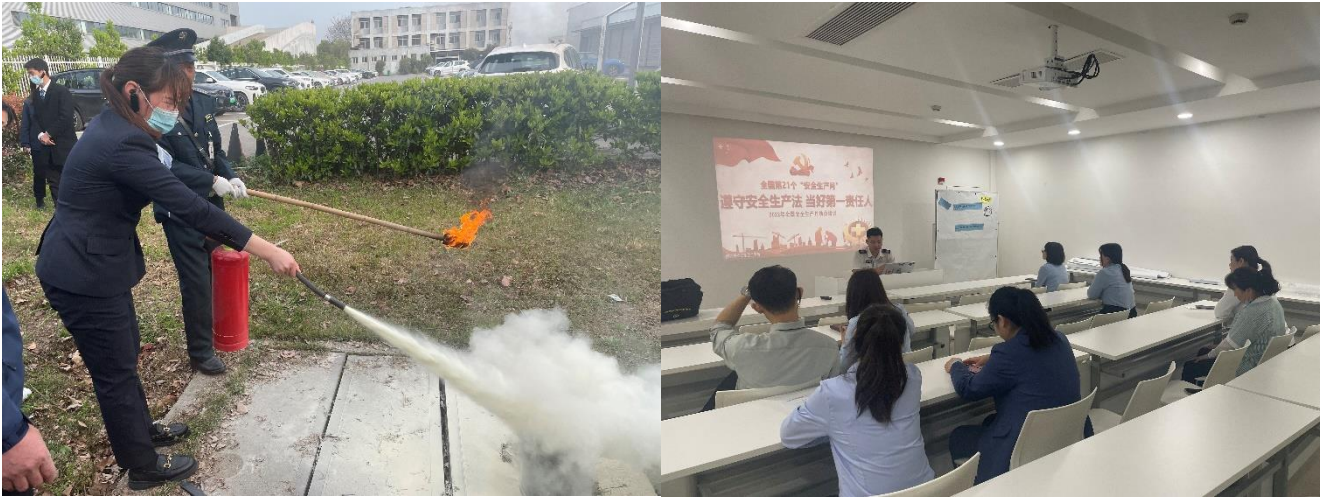
图为芜湖宝利盛为员工开展消防知识培训和消防现场演练活动

2、辽宁丰田金杯技师学院通过推进数字化设备改造和信息化教学，逐步实现教学手段的高质高效，目前办公及教学用计算机达到 80 台、交互式多媒体设备 94 套，在疫情期间发挥了良好的线上教学作用，同时减少了教学易耗品的浪费。