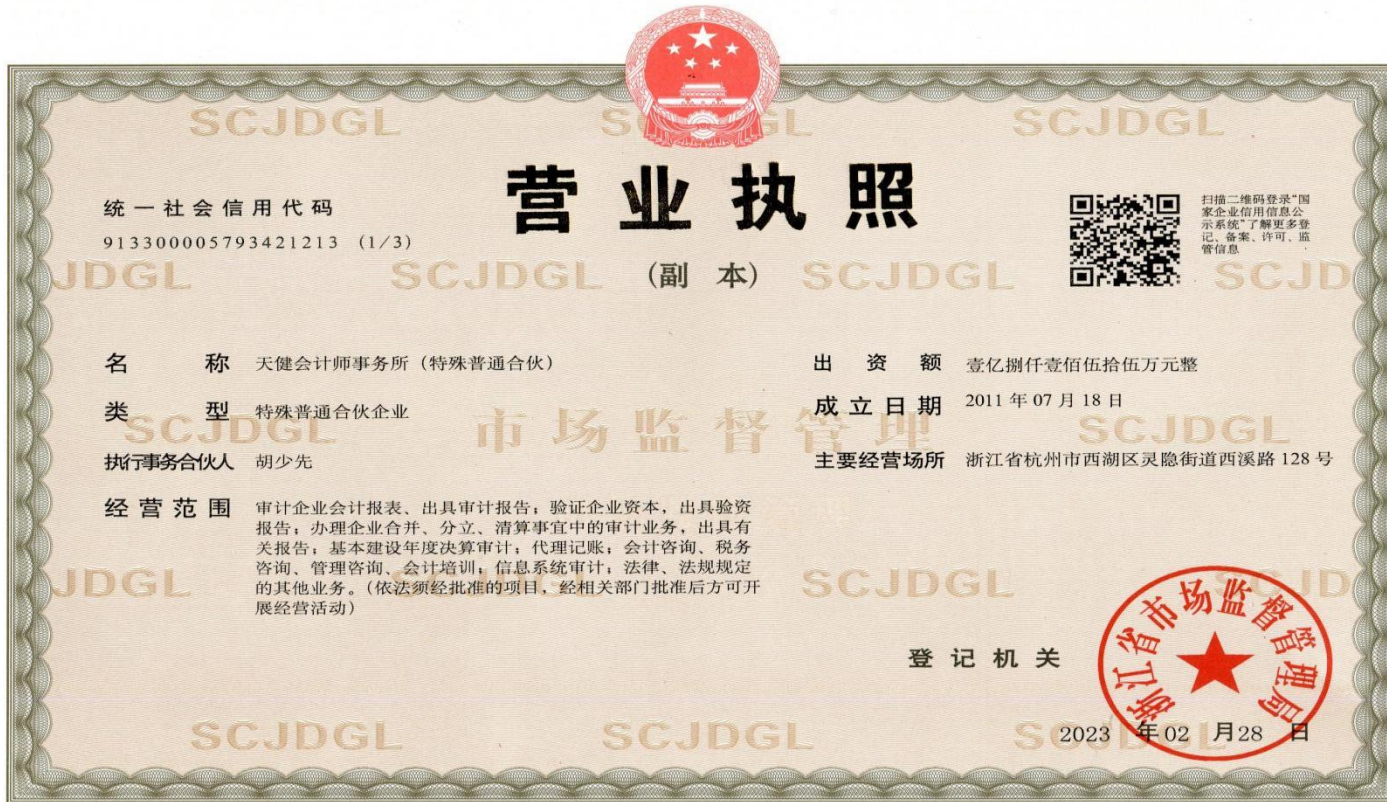
附件 1 本所营业执照复印件