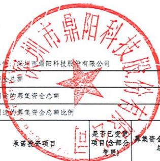
2022年度募集资金使用情况对照表