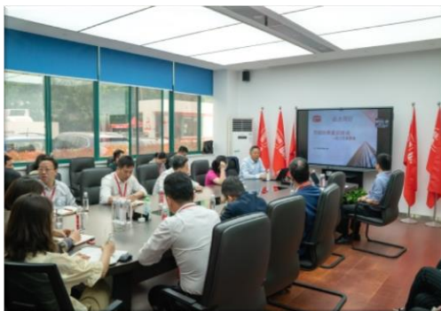
劳动法律意识培训

公司十分注重员工培训与职业发展规划，提高员工自身素质和综合能力，为员工提供更多的发展机会。公司组织发展部会分级别对不同层次、类别的员工开展包括新员工入职培训、管理人员技能提升、拓展训练、外出参观学习等多种培训。公司建立多层次、多元化的培训体系，并不断优化培训资源，营造内部学习氛围，为不同岗位、不同级别的员工提供全方位的职业培训与引导，实现技能提升与自我发展。