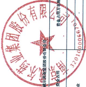
2022年度非经营性资金占用及其他关联资金往来情况汇总表