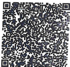
陈瑞璜年检二维码

本证书经检验合格，继续有效一年。 This certificate is valid for another year after this renewal.