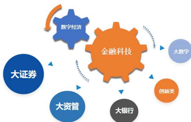
图：公司战略金融科技+数字经济双循环

公司通过主动投标、参与竞价的招投标方式，以及客户询价、公司报价的商务谈判方式获取业务，将公司相关产品和服务直接销售给目标客户并实施交付，同时向客户提供运营、数据、咨询及个性化定制服务。