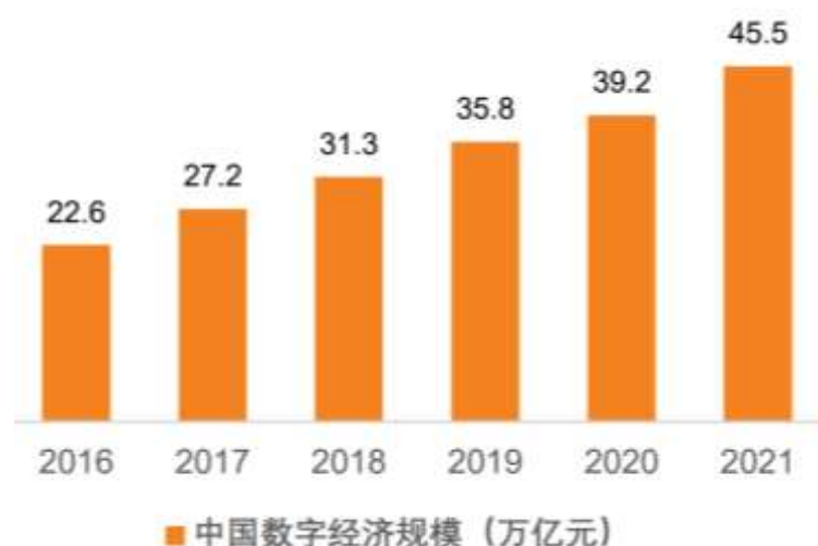
图：我国数字经济规模

公司基于在金融科技领域的核心软件能力，以创新数字技术赋能数字经济发展。近年来，数字经济上升为国家战略。党的二十大报告提出，加快发展数字经济，促进数字经济和实体经济深度融合，打造具有国际竞争力的数字产业集群。数字经济已成为中国经济增长的新动能，全面推动行业机构数字化转型既是助力证券行业高质量发展的内在引擎，也是更好地服务实体经济和满足人民群众需求的重要举措。