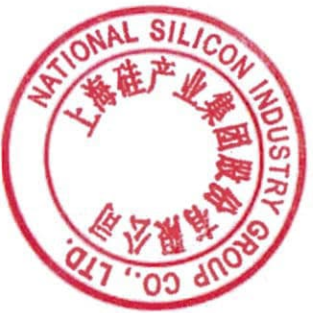
附表 1：首次公开发行股票募集资金使用情况对照表：