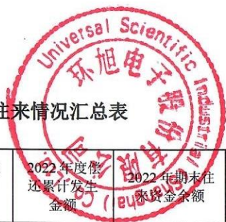
环旭电子股份有限公司 2022 年度非经营性资金占用及其他关联资金往来情况汇总表