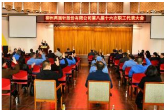
两面针第八届十六次职代会胜利召开

两面针构建民主管理制度体系，充分发挥职工代表大会民主管理、民主监督职能，2022 年年度职代会共计征集 159 条意见和建议，落实职工群众的知情权和参与权、建议权。充分发挥职工代表参与公司经营管理和民主监督作用，职工董事和职工监事参加了本年度董事会和监事会的各次会议，了解参与公司经营决策。同时，有关公司人事任命、评选结果等重大事项均通过公司内部网络渠道、公开栏向职工公布（公示），充分保障职工权益。