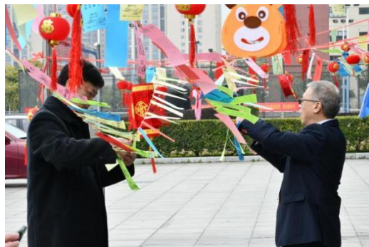
公司开展“我们的节日”系列活动