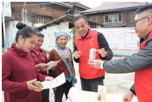
公司组织开展口腔科普活动