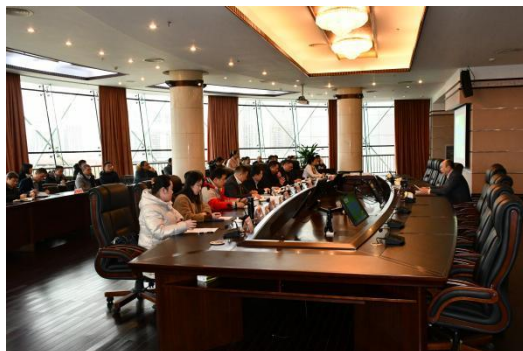
两面针开展民主评议工作