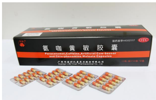
亿康药业生产的布洛芬、氨咖黄敏胶囊