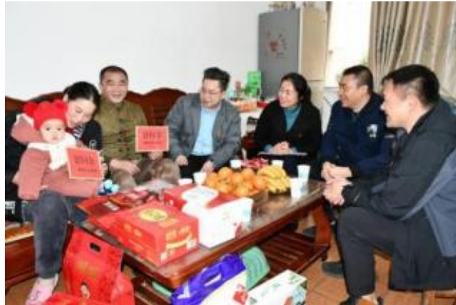
公司领导春节走访慰问职工家庭

问活动。重点慰问困难家庭职工、重病人员、建厂元老、劳模及外派异地工作的人员，发放慰问品及慰问金共 17.26 万元，为 11 户家庭困难职工子弟发放了助学慰问金 17.50 万元；在节庆时节，为职工发放月饼、粽子、油米等慰问品。在柳州市总工会的组织下，我们继续做好职工关怀工作，组织开展线上职工心理测评，报告期内未收到有关员工存在严重心理问题的反馈报告。