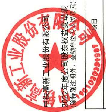
2022年度公司股东权益变动表 (除特别注明外，金额单位为人民币元)