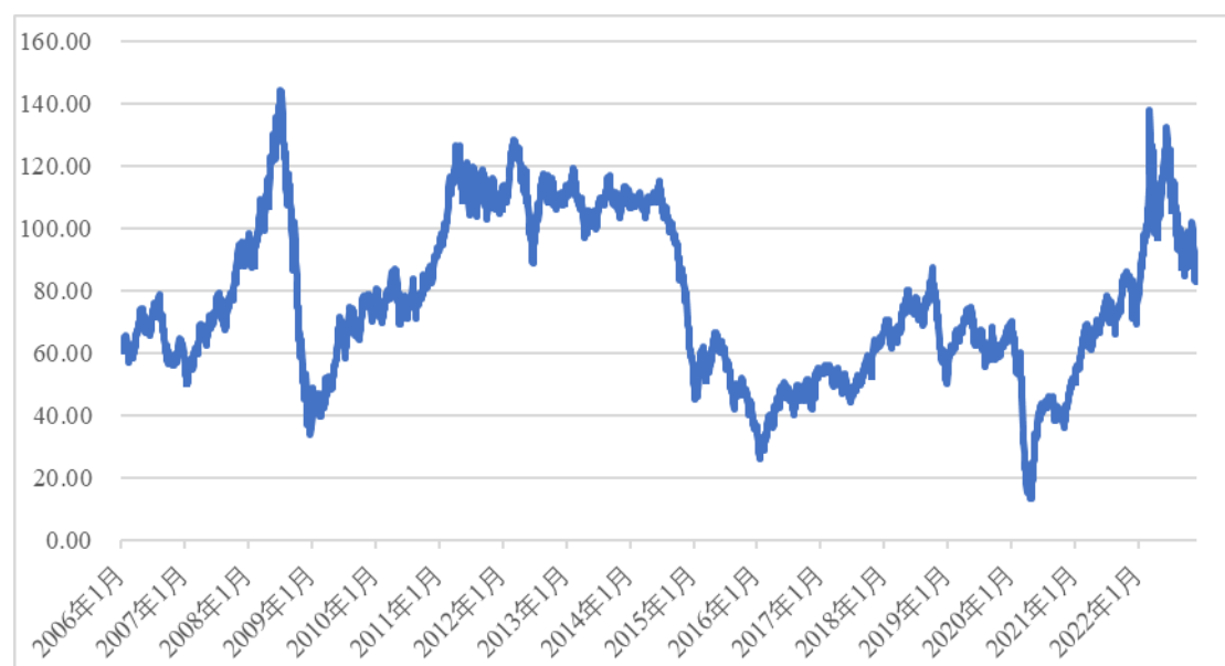
国际原油（英国北海布伦特）油价变动情况（单位：美元/桶）

随着世界经济形势的变化、石油开发投资规模波动等诸多因素的影响，本公司会面临石油天然气行业周期性波动，导致潜油泵电缆、连续油管、液压控制管等油服领域销售收入、经营业绩波动的风险。