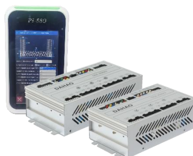
特种工业缝纫机电控系统