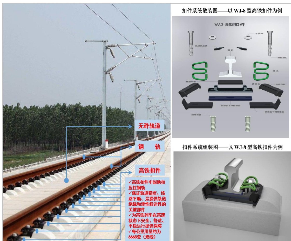
轨道扣件应用场景示意图