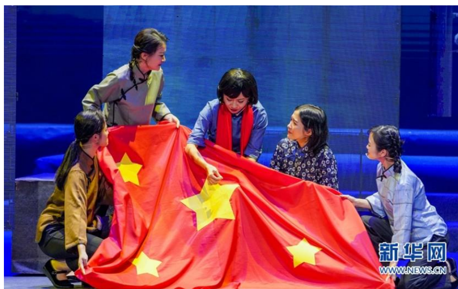
图：《百年风华》音乐史诗剧演出现场

奋斗历程为主题，选取中国共产党各个历史时期的经典故事，通过经典红歌、原创歌曲、背景视频、情景演绎和舞蹈表演等方式，带领观众沉浸式感受党的“百年风华”，从党的奋斗历程和伟大成就中汲取奋进力量。出品大型茶文化史诗音乐剧《茶道：一叶乾坤》，聚焦茶文化主题，运用音乐剧形态，将现代科技与传统文化有机融合，营造出全息沉浸的超然体验，彰显“构建人类命运共同体”的精神实质。