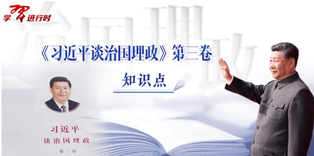
图：《〈习近平谈治国理政〉第三卷知识点》专题页面截图