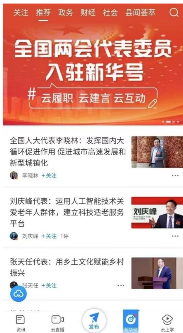
图：新华号页面截图

2. 抢占社交传播阵地。社交平台账号集群总粉丝量超过1.5亿，“硬核”内容屡屡打破“次元壁”进入“朋友圈”，成为移动端传播“原点”和“爆点”。