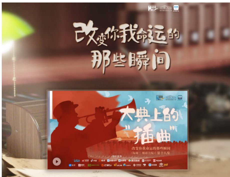
图：《改变你我命运的那些瞬间》专题页面截图

3. 积极引领网络舆论导向，凝聚同心同向同行广泛共识。 紧跟社会关注热点、找准舆论斗争痛点，勇于亮剑、善于发声，以权威主流声音引领主流舆论。《新华网评：晚舟归航，曲折起伏，也浸润着温暖，彰显着力量》被外交部发言人微博转发，转载量近千家。《新华网评：如此敷衍，永辉超市如何“永辉”？》等直接推动事件有效解决，赢得广大网民点赞。《民主不是可口可乐》等漫画海报寓意深刻、直击要害，产生“一图胜千言”之效。