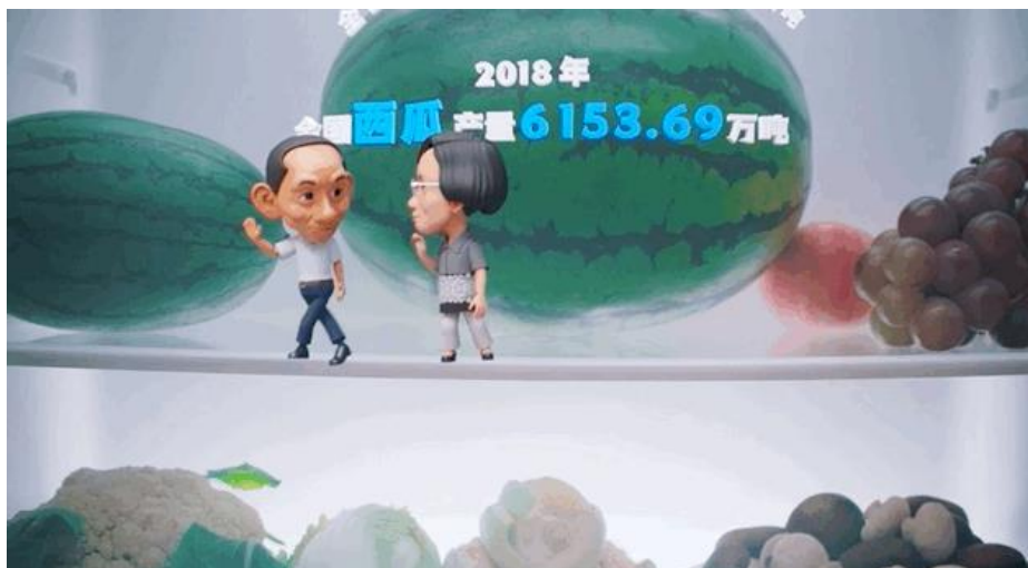
图：《寻味房游记》视频截图