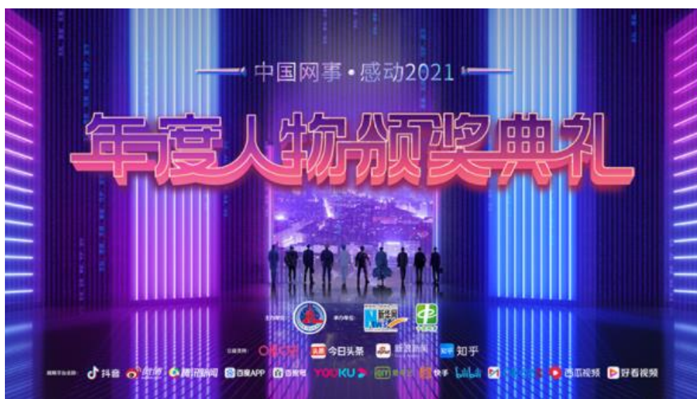
图：“中国网事·感动 2021”年度人物颁奖典礼报道截图

2. 支持公益事业。深入开展“中国网事感动人物系列评选”，聚焦“起源于网，放大于网，互动于网，影响于网”的网络正面典型，十二年来共征集到 600 多个单位推荐的 4000 多位（组）感动人物候选人，超过 10 亿人次通过投票、评论等方式参与评选活动，为网络空间持续注入正能量。不断升级新华网公益频道，重点打造“公益讲堂”“公益主张”“善举推广人”等原创内容，与广大政府机构、公益组织和社会力量一起，传播公益理念、开展公益活动、发起公益项目、寻找公益典范，推动全社会形成向上向善的强大力量和积极氛围。