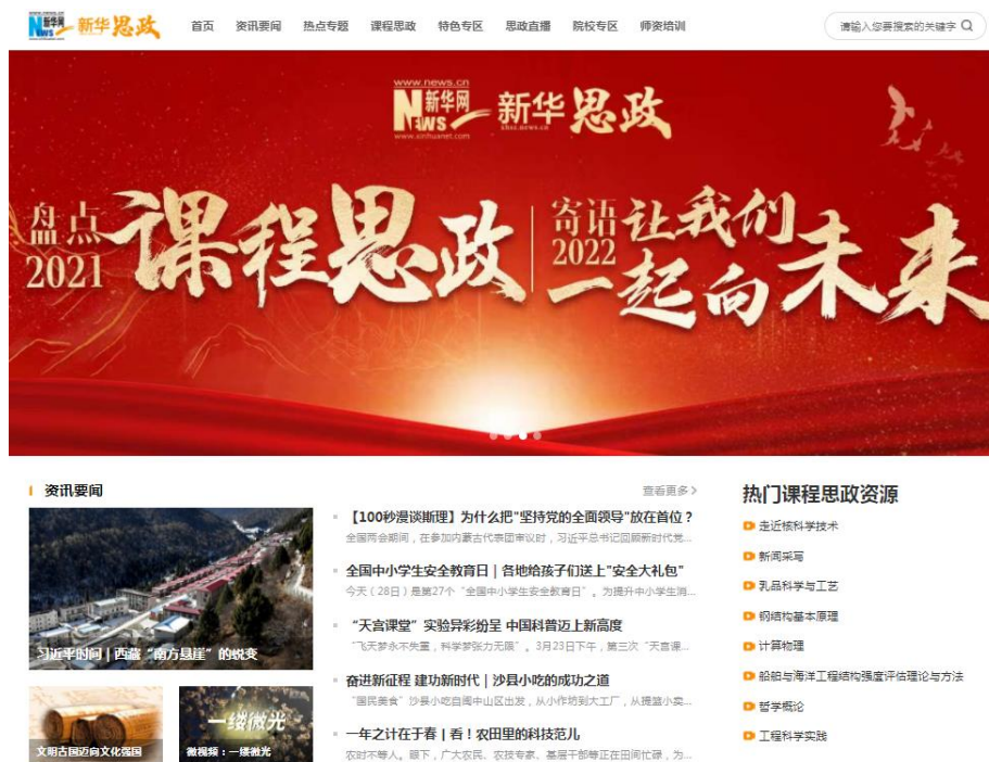
图：“新华思政”页面截图

2. 服务高校课程思政建设。推出“新华思政”平台，作为教育部课程思政示范课程展示指定平台，集资源建设、学习、交流于一体，截至 2021 年底覆盖 700 多所高校，上线课程思政案例课 600 多门，积极推广课程思政建设先进经验和做法，有力推动院校课程思政教学资源共建共享。