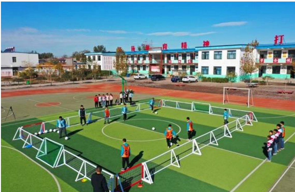
图：“县域青少年快乐足球公益行”活动相关物资在河北新河投入使用。

1. 助力乡村振兴。围绕乡村振兴、农业农村发展等重大主题，加大报道力度，做好网络宣传，推出原创栏目《振兴记录者》一系列优质内容，为全面实施乡村振兴战略营造良好舆论环境。发挥上市企业和互联网平台优势，充分利用舆论引导、平台搭建、资源连接等独特优势，联合中国足球发展基金会发起“县域青少年快乐足球公益行”，引入电商头部主播开展直播“云助农计划”，推出“看得见的改变”大型主题公益活动，出人、出力、出物、出资，帮助定点扶贫县巩固脱贫成果。