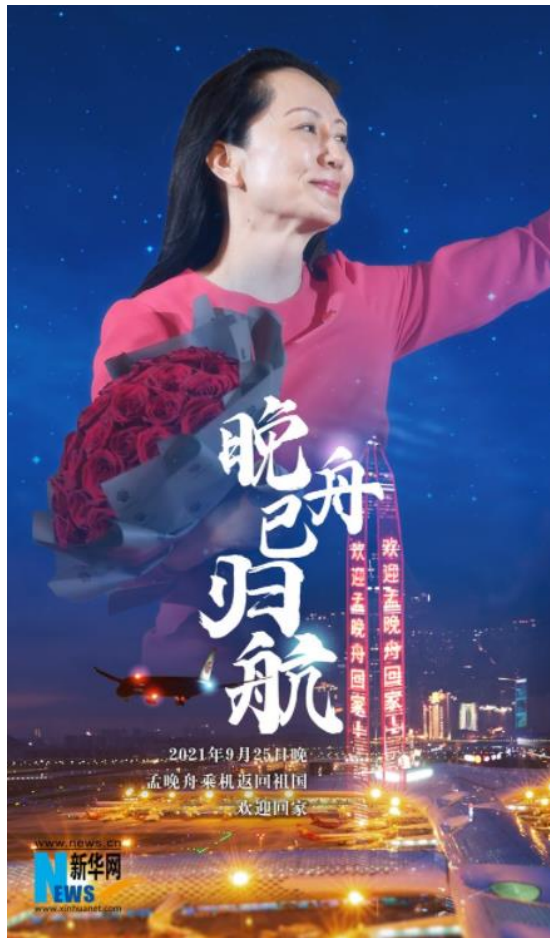
图：《新华网评：晚舟归航，曲折起伏，也浸润着温暖，彰显着力量》