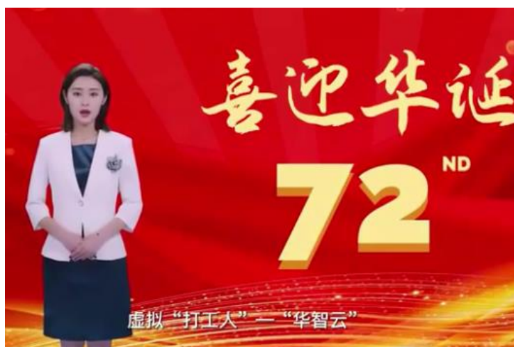
图：“虚拟新闻主播”华智云报道截图

1. 助力主流媒体数字化转型。 新华智云参与全国 29 个省融媒体平台建设，荣获“王选新闻科学技术奖”一等奖，推出“虚拟新闻主播”华智云，“新华云”成功入围中央国家机关云计算服务供应商名录，“新华睿思”在数据、算法、应用场景等方面全方位升级，为全国主流媒体融合发展赋能。