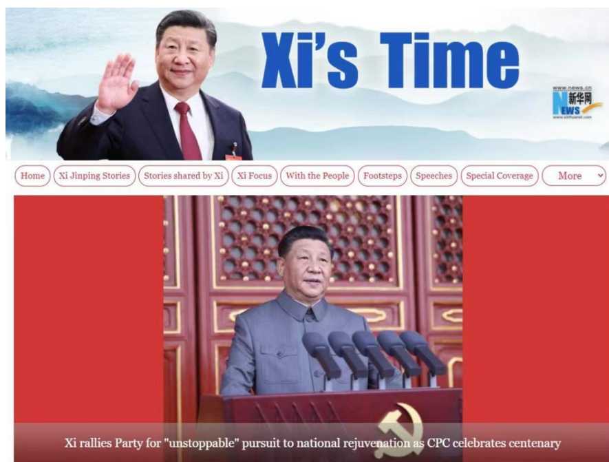
图：《习近平时间》英文专题页面截图