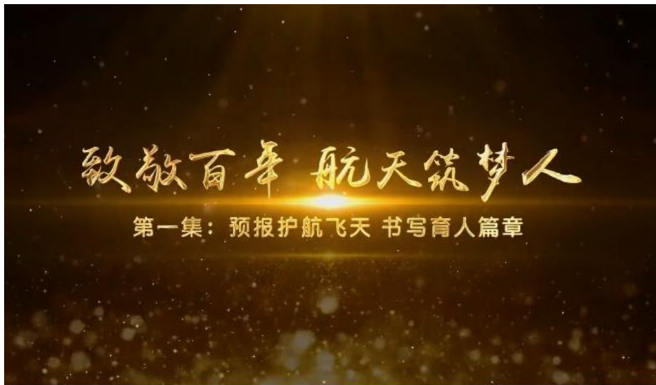
图：《致敬百年 航天筑梦人》视频报道截图

推出《云游地博》《中秋赏月》《观星之夜》等系列主题直播，打造品牌化科普短视频产品，推出《走进国家重点实验室》《致敬百年 航天筑梦人》《蓝奇奇探索记》等系列栏目，更好激励青少年学科学、爱科学、用科学。