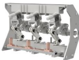
环网柜负荷开关单元开关