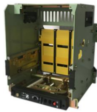
低压断路器框（抽）架