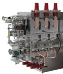
环网柜断路器单元气箱