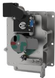
环网柜负荷开关单元操作机构