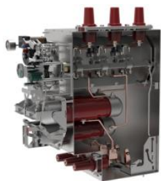
环网柜组合电器单元气箱