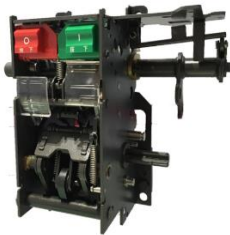
低压断路器操作机构

公司主营业务为高、低压断路器关键部附件、智能环网柜及其关键部附件的研发、生产和销售，是目前我国高、低压断路器关键部附件和智能环网柜及其关键部附件行业中研发、生产、服务能力位于前列的企业之一。公司产品主要用于电力系统的配电设施，包括低压及中高压断路器配套用框（抽）架、操作机构、附件和智能环网柜及智能环网柜的断路器单元操作机构及开关、负荷开关单元操作机构及开关、组合电器单元操作机构及开关等。