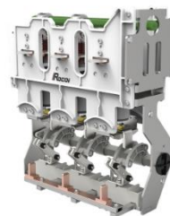
环网柜断路器单元开关