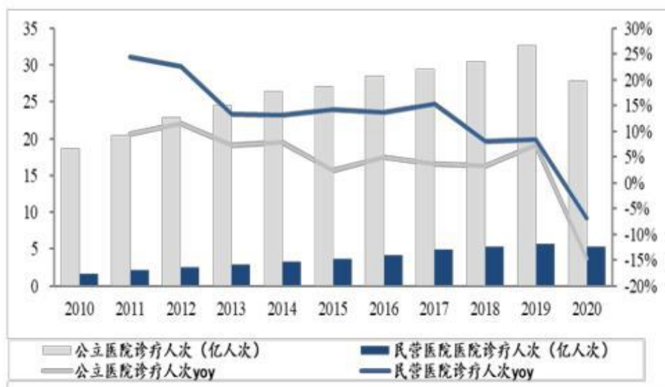
图 3: 公立医院和民营医院诊疗人次

随着我国人口老龄化，看病就诊需求正在逐步扩大，近十年来，无论是公立医院还是民营医院，均有明显上升。2020 年因受到新冠肺炎疫情影响出现负增长，但长期来看就诊需求保持持续增长。