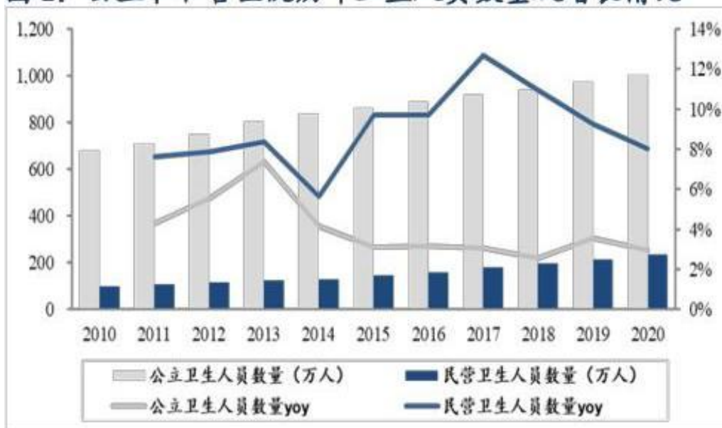
图 2: 公立和私营医院历年卫生人员数量及增长情况