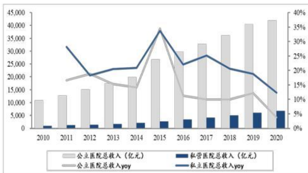
图 4：公立和私营医院年总收入及增长情况

受制于体量、综合服务能力和医保制度等因素，公立医院的总收入远高于民营医院。但近十年来民营医院的增长率也保持了非常高的水平，除2020年受到新冠肺炎疫情影响，其余年份均达到20%以上的增长率。