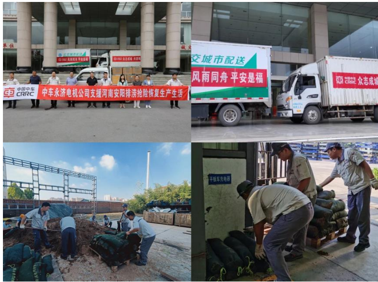
支援河南安阳排涝抢险恢复生产生活