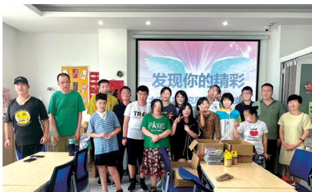
志愿者与孩子们的合影

2021年8月，中车大连所的志愿者走进大连市阳光多元智能馆，这里是针对心智障碍儿童设立实施的“康复+教育+就业”培训机构。志愿者们与孩子们开展至诚至爱的共融活动，陪他们唱出对生活的热爱、对成长的喜悦，让孩子们享受到家一样的个性化陪伴。