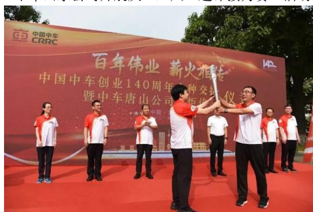
中车创业 140 周年火种交接暨中车唐山公司火炬传递仪式