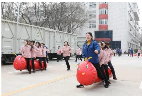
中车山东公司开展庆“三八”趣味接力赛”活动

舞士气的文体活动，把文化艺术节打造成凝聚员工精气神的文化品牌，丰富员工精神生活。