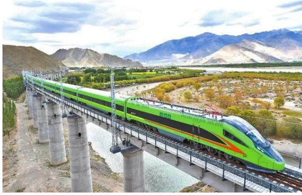
“复兴号”内电双源动车组行驶在拉林铁路上