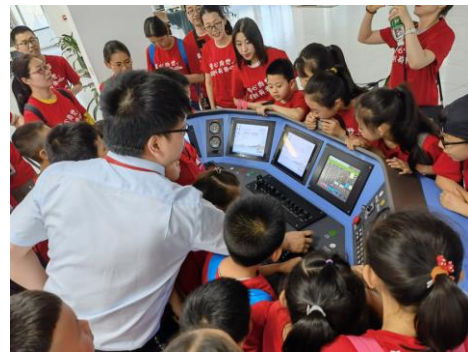
“童心向党 科创有我”科技开放日