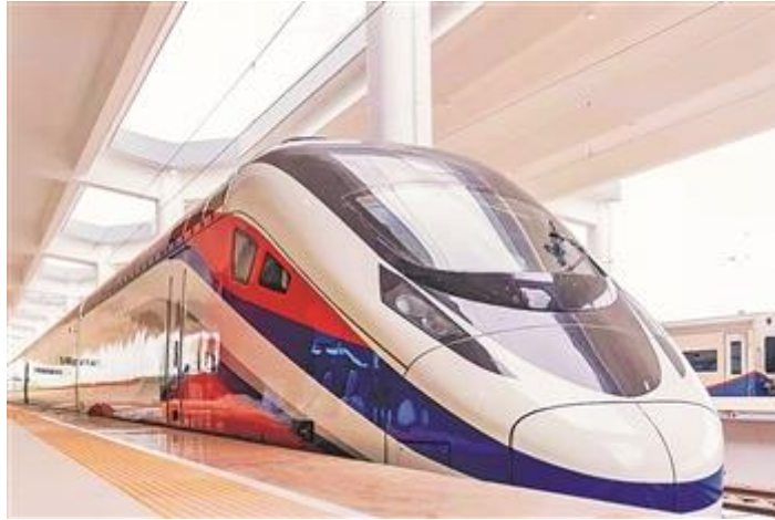
“澜沧号”动车组驶抵万象站

此外，中老铁路国际货物班列均由中车大连公司 HXD3C 型电力机车担当牵引主力，适应中老铁路线路连续大长坡道与高温高湿环境的要求。货物班列运行时间不到 30 个小时，跨境运输的低成本、快速度，为中老铁路沿线众多产业带来新的发展机遇。