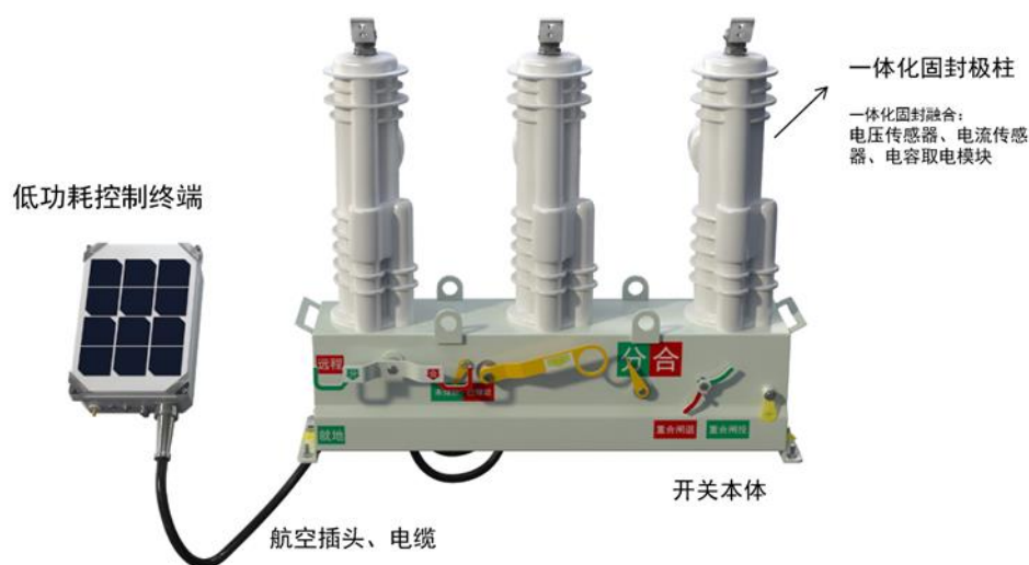
图 2：公司智能柱上开关产品示例