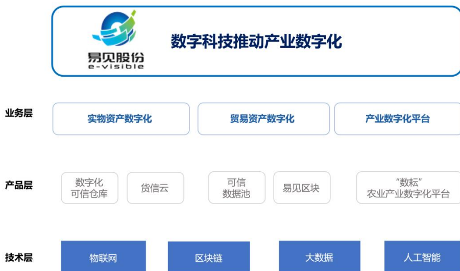
公司科技板块的整体架构图