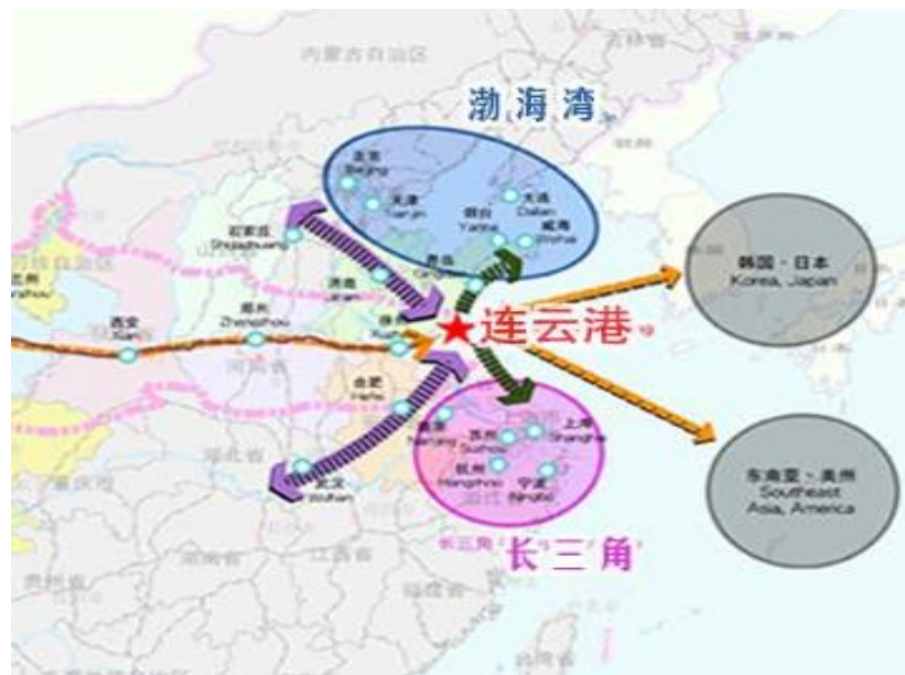
连云港地理位置（图）

本项目选址连云港市。连云港市位于江苏省东北部，南连长三角，北接渤海湾，西依大陆桥，处于连接新亚欧大陆桥产业带、亚太经济圈、环渤海经济圈和长三角经济圈的“十”字结点位置，为陆上丝绸之路和海上丝绸之路交汇点（详见下图）。连云港出色的港口位置、良好的海运条件，能够有效降低物流成本。根据中国工业统计年鉴的历年数据显示，江苏、山东两省装备制造业占全国较高比重，连云港市特殊的地理位置使得本项目能够辐射江苏、山东两省及其他区域机械加工行业广阔的市场空间，为本项目产能消化提供保障。