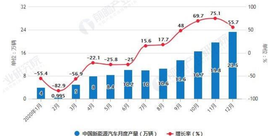
2020年1-12月中国新能源汽车月度产量统计及增长情况

2020年10月，国务院常务会议审议通过了《新能源汽车产业发展规划（2021—2035年）》。《规划》将坚持电动化、网联化、智能化发展方向，深入实施发展新能源汽车国家战略，以融合创新为重点，突破关键核心技术，提升产业基础能力，构建新型产业生态，完善基础设施体系，优化产业发展环境，推动我国新能源汽车产业高质量可持续发展，加快建设汽车强国。提升服务保障水平与用户充电体验，为新能源汽车产业发展营造更好的环境