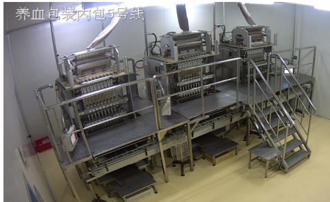
(图片为养血清脑包装车间)

公司遵循技术引领、工艺推动、终端控制理念，实现“少用、再用、多产、少排”，使绿色环保的理念深植在生产的每一个环节，工厂的每一个角落，践行企业能源管理的社会责任。