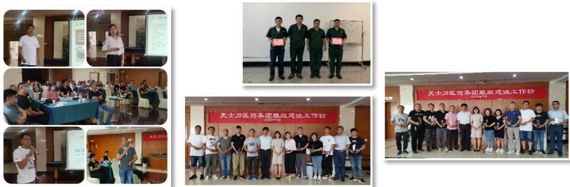
(图片为一线班组建设)

完善员工沟通渠道建设方面，公司通过“人力资源中心微信平台”及“员工阳光之家”微信公众平台及时向一线班组长和员工推送公司最新战略、班组管理、健康养生知识、活动信息。同时为员工搭建顺畅的双向沟通机制，避免了冲突，增加员工对企业的信任，实现了“文化到员工、管理到班组”，打造和谐的员工文化和卓越的绩效，形成高效工作，快乐生活的良好氛围。