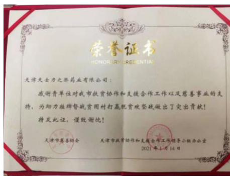
(图片为扶贫捐赠荣誉证书)

公司积极响应国务院扶贫办启动的社会力量助力挂牌督战村项目，结对帮扶新疆于田县。报告期内，公司建立帮扶资金 200 万元，由天津市慈善协会分别拨付给予田县英巴格乡艾斯尼提木村 100 万元、于田县英巴格乡巴格恰村 100 万元。除此之外，子公司天津天士力之骄药业有限公司（以下简称“天士力之骄”）向新疆于田县阿热勒村捐赠 2 万元，为助力挂牌督战贫困村做出了突出贡献，天津市扶贫协作和支援合作工作领导小组办公室特此授予天士力之骄荣誉证书。