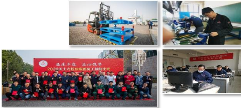
(图片为员工技能比武)

良好氛围。在一线部门开展多形式、多维度的技能比武，总结推广优秀经验，发掘培养蓝领人才，弘扬工匠精神，显著提升一线员工操作技能。