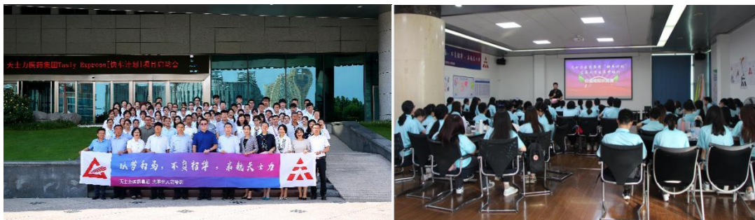
(图片为人才发展系列项目照片)

理”与“专业”双通道的人才储备工作。在具体人才发展项目运营过程中，组织开展“成长计划”、“快车计划”、“班组长培训”、“1+X 领导力培训”等人才发展项目，打造多维度、广覆盖的立体式人才培养机制。