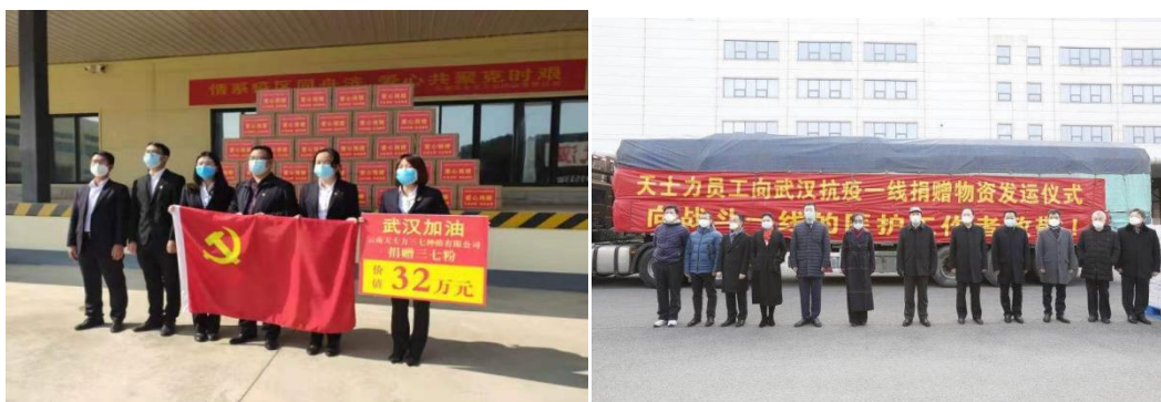
(图片为抗疫驰援捐赠图片)