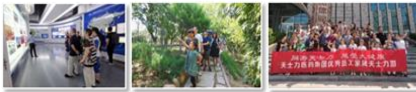
（图片为优秀员工及家属天士力游）

在员工关怀方面 ，传承公司“以人为本”的核心理念，实施《医药集团2019-2020年度员工关怀项目方案》，为员工发放20年服务奖奖牌，鼓励优秀员工长期为天士力服务；开展一线优秀员工及家属天士力游活动，近距离感受企业发展成就，表达公司对优秀员工家属的感谢。这两项活动得到员工的积极反响，对于加强员工的向心力、凝聚力，助力企业高速发展，将起到积极的促进作用。