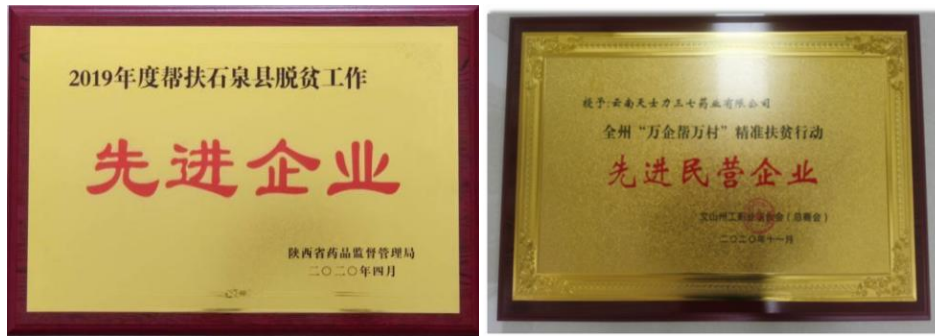
(图片为扶贫先进企业证书)

万村”精准扶贫行动领导小组办公室发布《关于对 2020 年全国“万企帮万村”精准扶贫行动先进民营企业评选表彰候选推荐对象的公示》，云南省工商联、省扶贫办结合全省“万企帮万村”台账数据、2019 年度民营企业履行社会报告以及今年疫情期间企业捐赠情况等推荐 5 家企业为 2020 年全国“万企帮万村”精准扶贫行动先进民营企业，云南天士力荣幸入选。2020 年 11 月云南天士力荣获云南省文山州“万企帮万村”精准扶贫先进企业。