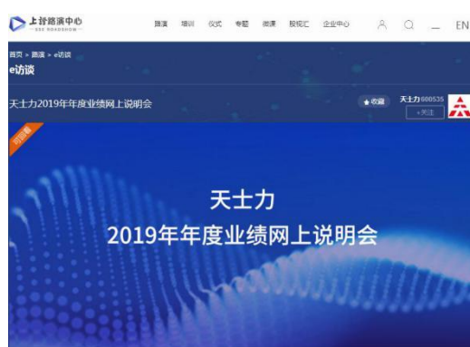
（图片为2019年年度业绩网上说明会）

2020年5月和6月，公司分别参加了上海证券交易所上证互动易平台的2019年年报网上业绩说明会，以及天津证监局主办、天津上市公司协会协办的“诚实守信做受尊敬的上市公司——天津辖区上市公司网上集体接待日”活动。两个活动期间，公司高管与工作人员一起就2019年年报财务数据、公司治理、发展战略、经营状况、研发进展等投资者关心的问题逐条给予回复。两个投资者沟通交流活动在疫情期间缩短了投资者与上市公司之间的距离，有效促进了两者间形成的良性互动关系，从而推动实现公司价值和股东利益最大化。