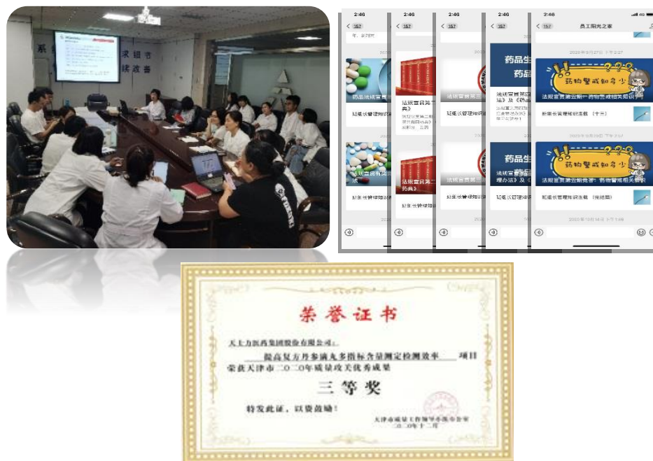
(图片为质量系统开展活动及获得奖项)

质量管理体系文件,全面对标,并开展丰富的线上法规宣贯及答题活动,全员宣贯,顺应法规标准提升,确保质量管理体系的持续合规有效。开展“2020 年药品法规线上宣贯”答题,提高法规普及率。共 5 期,持续两个月,浏览宣贯文章 1054 人次,参与答题 219 人次,50 人次获得优秀奖,8 人获得勤学奖。国际产业中心质量检验组被“天津市质量工作领导小组办公室”授予质量攻关优秀成果三等奖。