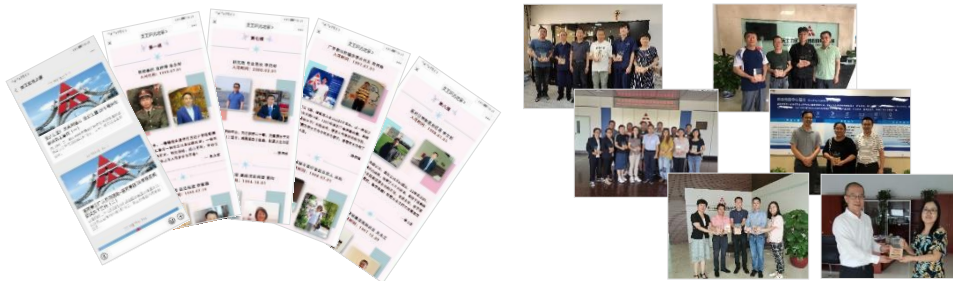
（图片为20周年员工感言并颁发奖牌）