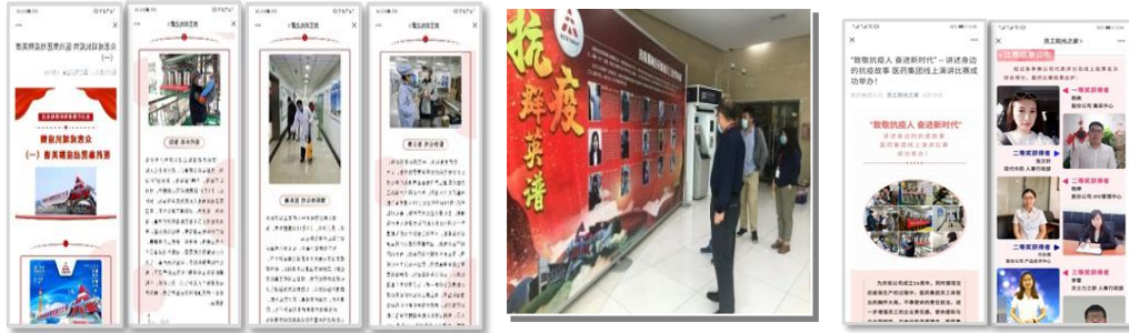
(图片为抗疫系列活动照片)

演讲者从不同视角讲述在抗疫保生产的关键时刻，一批批无名英雄舍小家，顾大家的感人故事，在百年不遇的大疫面前，他们都是“逆行”战士。