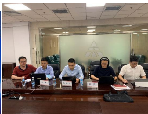
（图片为2019年年度业绩网上说明会现场照片）