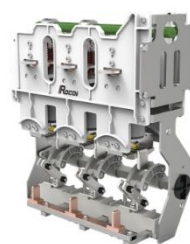
环网柜断路器单元开关