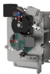
环网柜组合电器单元操作机构