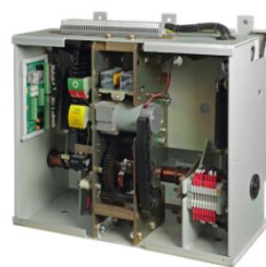
中高压断路器操作机构