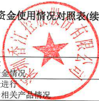
募集资金使用情况对照表(续)