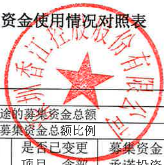
募集资金使用情况对照表