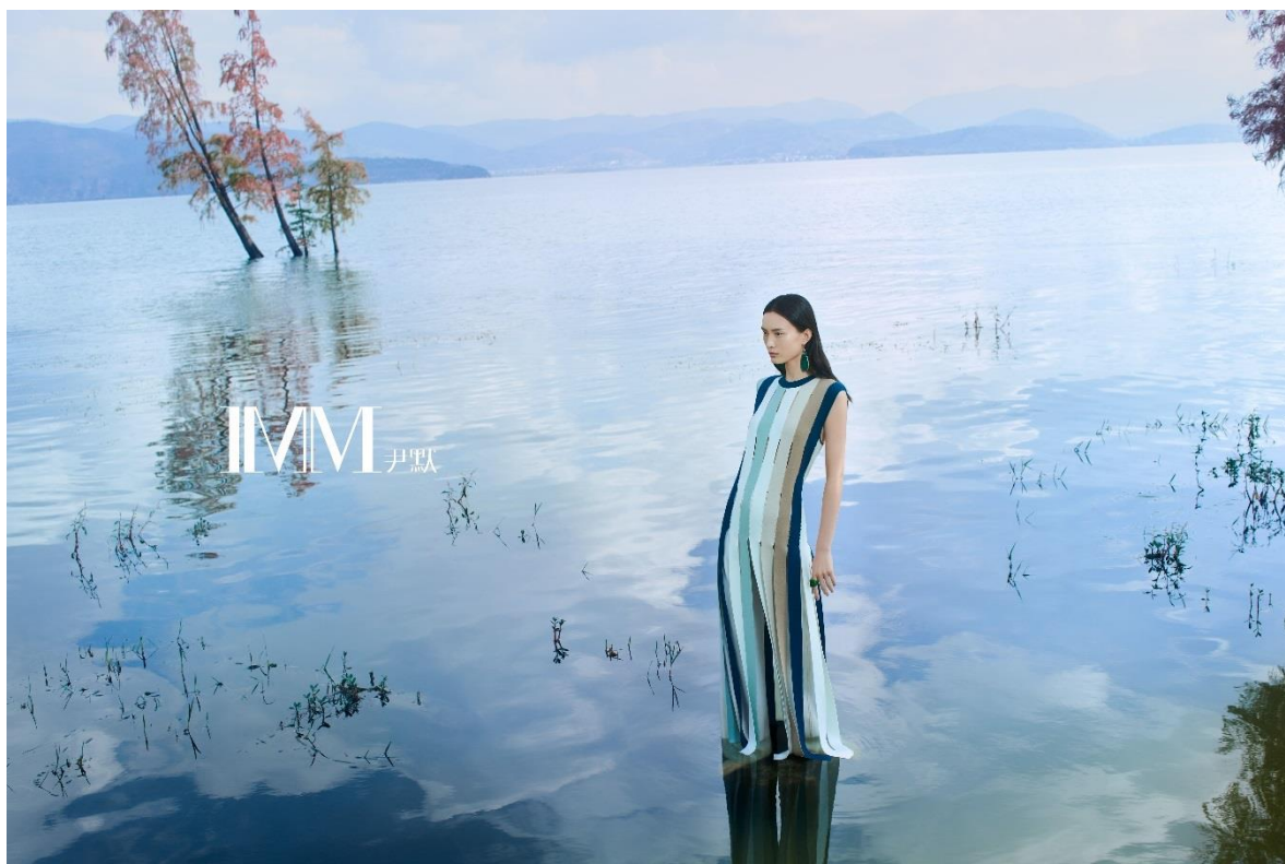
IMM 尹默品牌形象大片

2008 年“IMM 尹默”品牌的创立，开启了公司多品牌运营的经营战略。“IMM 尹默”品牌以 28-35 岁为核心年龄层，致力于打造独立、知性具设计启发性的中高端时尚品牌，通过设计师大胆的创新，展示现代女性的独具个性的艺术结晶。“IMM 尹默”的设计理念是独立、知性、具设计启发性的中高端时尚女装品牌，以独树一帜的“IMMist 素人”的时尚艺术语言传达出品牌特有的设计风格与意识形态。通过对服装线条和块面进行解构，探索一衣多穿的概念，结合个性的面料和原创花型，构建出充满尹默痕迹的时尚衣柜。因此，作为注重艺术融合的中高端女装品牌，“IMM 尹默”品牌具有较“JZ 玖姿”品牌更为高端的市场定位和价格区间，处于公司品牌集合的高端。