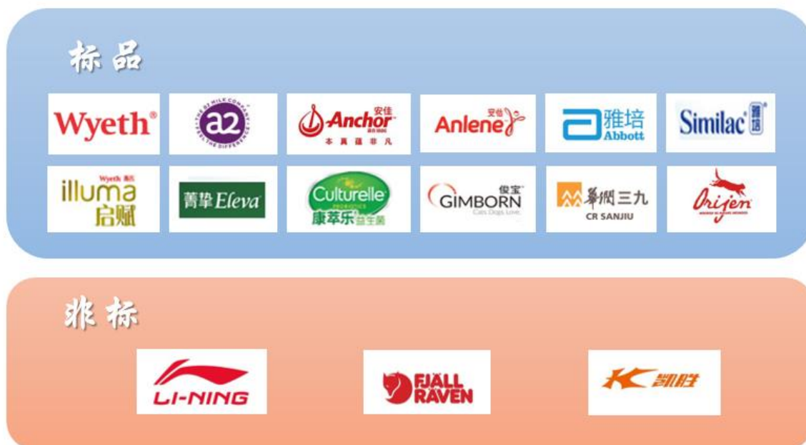
礼尚信息核心服务品牌

经验，礼尚信息已具备孵化独立自有品牌的能力，在今后的发展中将不断整合上下游资源，打造极具潜力的自有品牌。