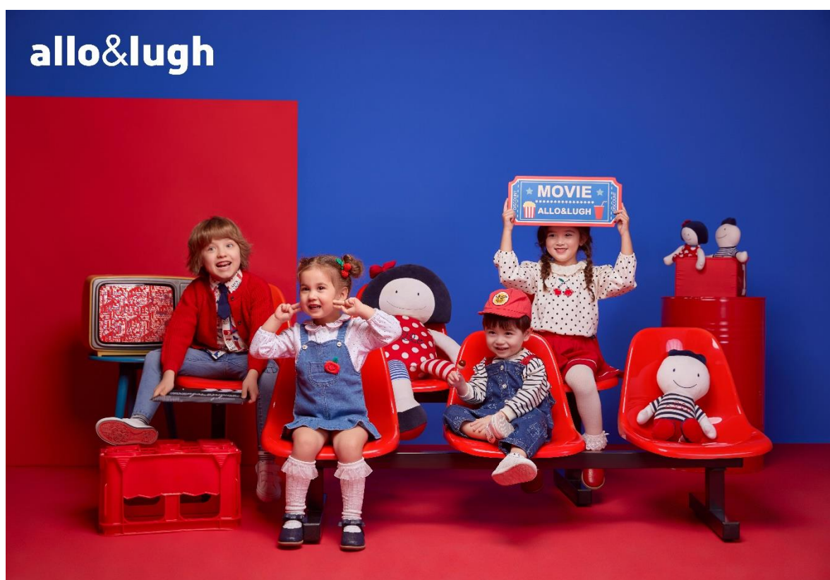
ALLO&LUGH 阿路和如品牌形象大片

“ALLO&LUGH 阿路和如”是韩国童装知名品牌，致力于为广大婴童消费者提供舒适、安全、精致的童装产品，具有传达整整齐齐、自由自在的设计理念，拥有独特的设计风格，于2005年进入中国，在中高端童装市场拥有较高的知名度和认可度。“ALLO&LUGH 阿路和如”主目标客户群为0-7岁的婴幼儿童，符合追求优质的面料与舒适的体验的消费者的要求，品牌产品涵盖大童装和小童装俩大类别，包括上衣、外套、裤、裙、羽绒服、家居服、配饰等多个品类，广泛满足从初生婴儿到大龄儿童的各式衣着需求。公司于2019年8月28日以现金增资方式取得了零到七贸易（上海）有限公司51%的控股权。零到七贸易（上海）有限公司主营业务为“ALLO&LUGH 阿路和如”品牌童装及儿童用品业务的品牌运营。