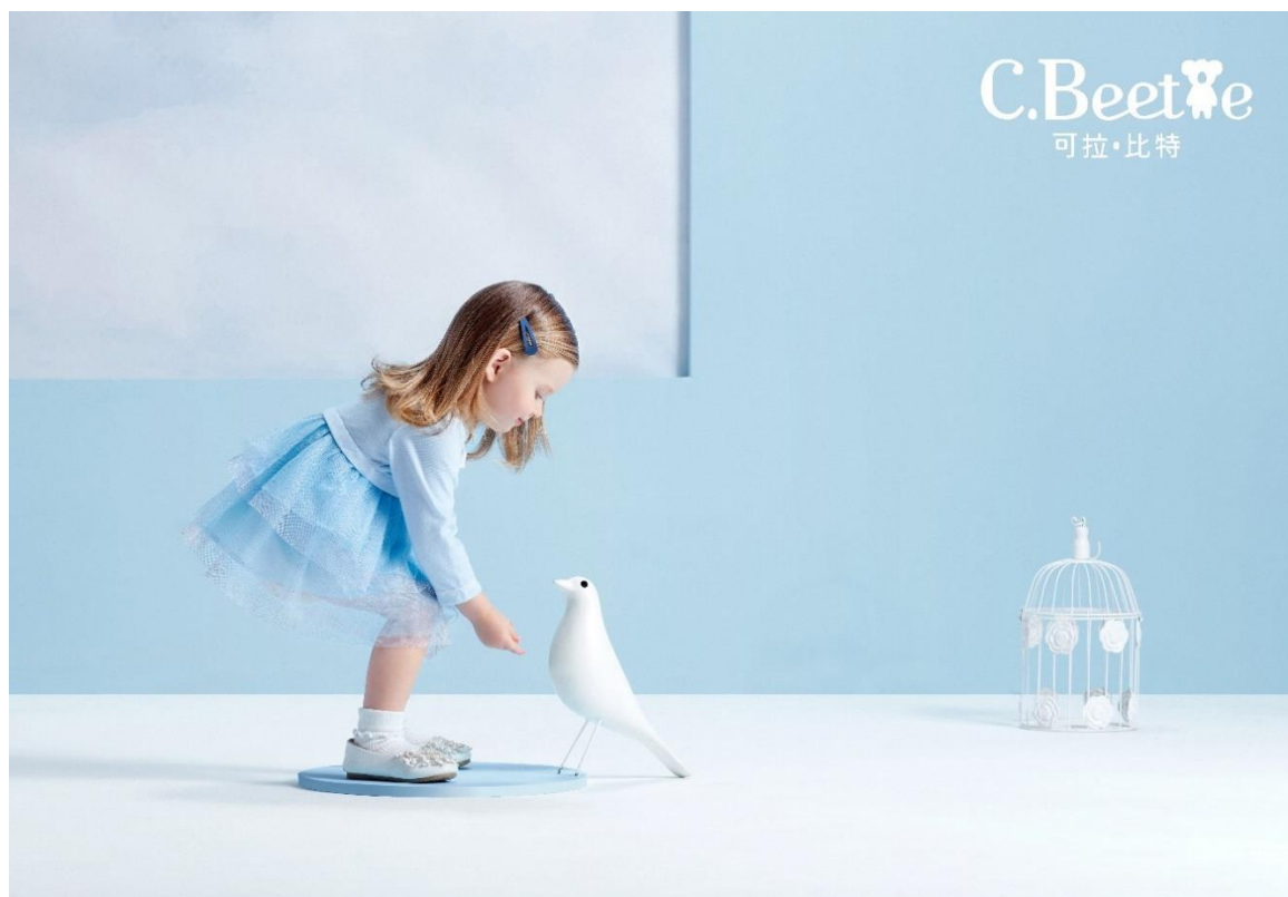
Coloured Beetle 可拉·比特品牌形象大片

“Coloured Beetle 可拉·比特”品牌是专为新生代的婴幼儿童打造的一站式外出服品牌，核心目标客群为 0-6 岁婴幼儿童，致力于满足对婴幼儿童服装兼具实用性和时尚度的 85-90 后年轻父母的要求。品牌定位中高端，以线下母婴渠道、婴幼儿连锁为主要销售平台，以具有品味的产品设计，引导小朋友从小树立自然、环保、有品位的意识。“Coloured Beetle 可拉·比特”品牌系上海蛙品儿童用品有限公司旗下婴幼儿童品牌。