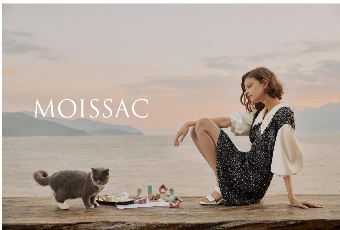
MOISSAC 摩萨克品牌形象大片

“MOISSAC 摩萨克”是源自法国的时尚女装品牌，以 25-35 岁为目标客户年龄层，融合法式时尚与当代流行元素，将轻熟女性清新优雅的特质毫无保留的展现出来，为都市女性提供时髦、简约、跨场合的着装。“MOISSAC 摩萨克”秉承自由随性的态度，延续品牌一贯高水准的时装制版工艺、独特的细节设计，充满灵气又精致浪漫。轻纱上的花卉图案、飘逸的衣衫线条，精致运用的蕾丝钩花，加之合身剪裁及华美的整体配搭，散发出清新优雅的法式风尚。“MOISSAC 摩萨克”以其梦幻俏皮的设计元素、华丽精致的设计形式和法式浪漫的设计风格塑造出别具一格的时尚女装品牌。“MOISSAC 摩萨克”品牌于 2014 年加入公司，从品牌风格、文化内涵、价格区间及客户覆盖等方面进一步提升了公司品牌的多样性和互补性。