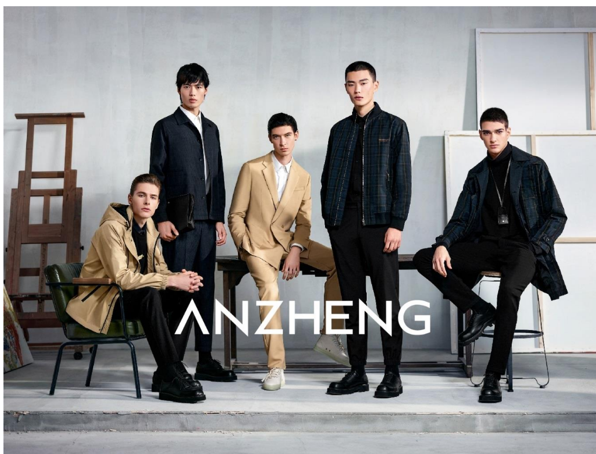
ANZHENG 安正品牌形象大片