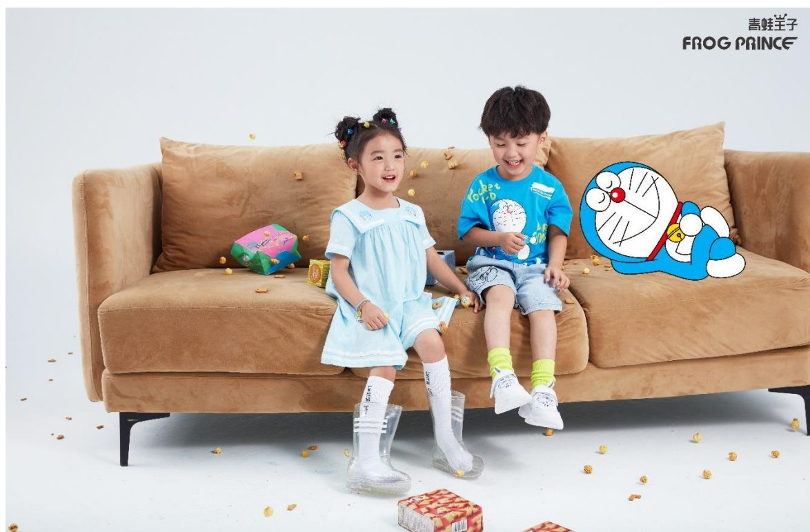
FROG PRINCE 青蛙王子品牌形象大片

“FROG PRINCE 青蛙王子”是中国十大童装品牌之一，拥有超过 20 年的品牌发展历程，核心客群为 0—16 岁的大小童，致力于满足孩子们在学校、假日、派对、休闲游玩等不同场合的穿着，赋予孩子自信、积极、向上的穿着方式。“FROG PRINCE 青蛙王子”产品分为文艺、休闲、运动三大系列，全面覆盖 0-16 岁儿童的服装、童鞋、配饰等全品类。“FROG PRINCE 青蛙王子”系上海蛙品儿童用品有限公司旗下童装品牌，公司于 2018 年 12 月、2019 年 9 月、2020 年 2 月通过股权转让及增资的方式累计持有其 50% 的股权。