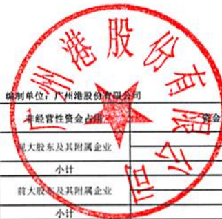
广州港股份有限公司2020年度非经营性资金占用及其他关联资金往来情况汇总表