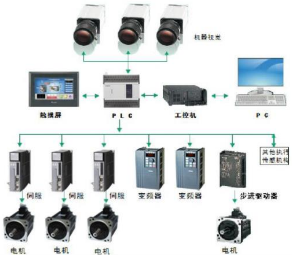
公司整体工控自动化解方案示意图