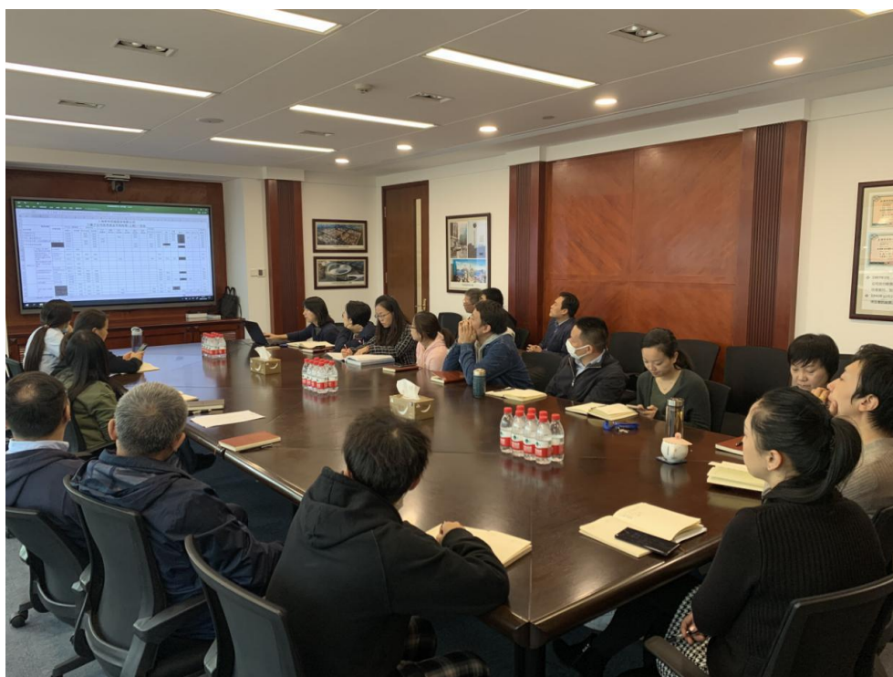
图为公司总部为员工开展培训

为及时提升员工整体素质及专业技能，更好地适应工作需要，同时增强企业核心竞争力，公司总部根据整体战略规划目标及各层级员工培训需求开设培训课程，下属各经营类子公司根据岗位技能需要，通过内部讲师培训、竞赛集训、外部交流培训等方式提高员工岗位技能。2020年公司总部开展含“关于新证券法修订要点及对上市公司影响”、“疫情期间防范知识普及、相关劳动法政策解读”、“改善执行力问题就这九步”、“中层管理者的角色认知”、“非财务经理的财务管理”“消防安全知识培训及演练培训”等各类课程11项，培训人次330人，培训课时775小时。全系统共计开展各类课程103项，培训人次593人，培训学时2987小时。公司下属4S店会针对岗位性质，对员工开展关于汽车品牌发展史、全系车辆参数配置、专业技能等培训，确保相关人员胜任岗位职责。