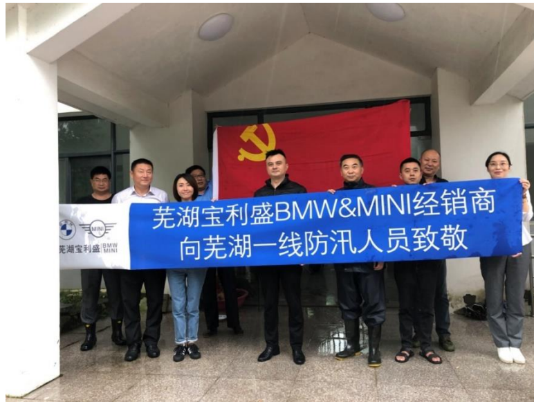
图为芜湖宝利盛为防汛一线送去救援物资