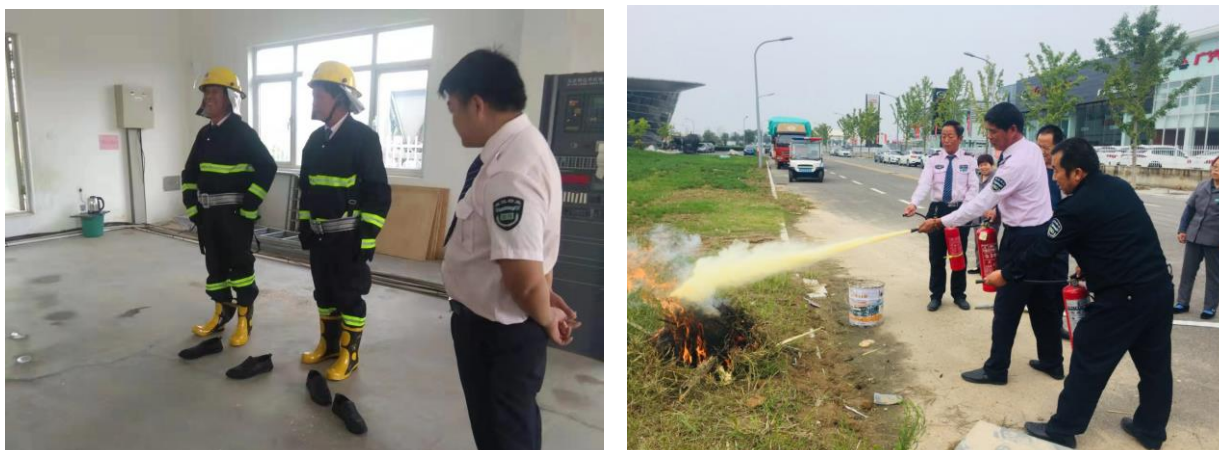
图为渭南汽博园消防演习活动