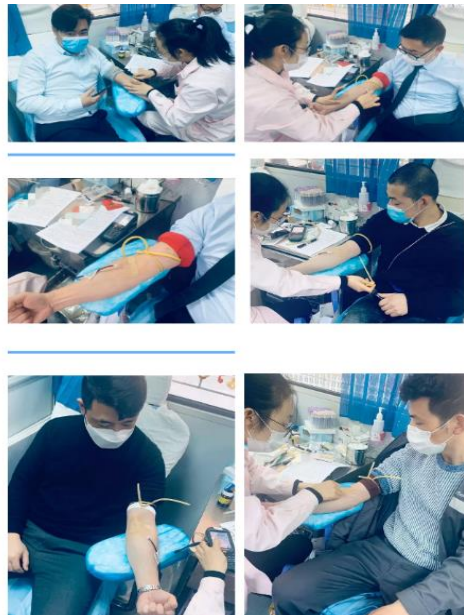
图为宣城宝利丰职工为抗击疫情集体献血

2020年3月，突如其来的新冠疫情使得全国多地采供血工作形势严峻，血液募集面临着前所未有的困难，医院中，外伤、血液病、孕产并发症、重大手术患者，以及部分新冠肺炎重症患者的救治工作，一刻也离不开血液的支撑。为此，宣城宝利丰组织了一场献血爱心活动，职工们众志成城，挺身而出，献出一份热血和爱心，为共同抗击疫情贡献了自己的力量。