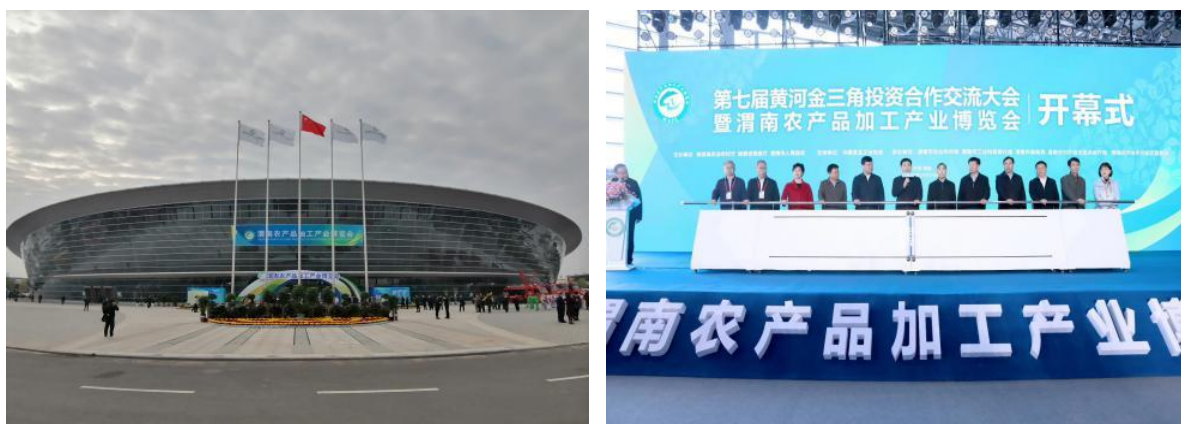
图为渭南首届农产品加工产业博览会

上海明友泓浩、弘贤分别是申华旗下主营吉利品牌和领克品牌汽车的 4S 店。为提升服务品质，保障客户安全，两家 4S 店年内陆续开展了客户上门免费更 n95 空气滤芯、对车内进行低酒精消毒、赠送防护用品、疫情期间为客户上门赠送蔬菜等活动，并通过服务管家活动对客户开展终身质保、终身道路救援等服务，获得了客户满意度的不断提升。