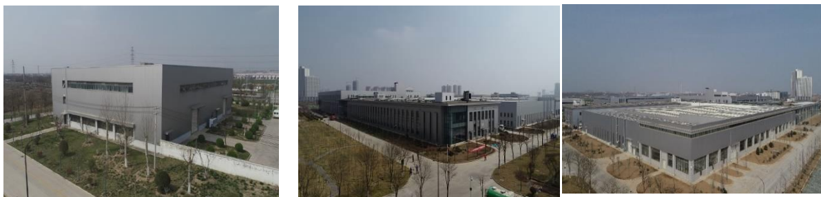
图：公司产业园厂房建设现场

四是深化精益管理，提升基础管理。运营大数据应用初见成效，数字化研发规模应用普及，制造数字化与装备履约全面加速，核心管理业务实现全面“线上跑”。推进体系效能型军工核心能力建设，制定数字化精密光学加工车间建设方案、数字化精密机械加工车间建设方案，产业链逐步从低端环节转向高端环节。统筹推进产业园建设，生产及辅助单元建筑工程基本建成，101#光电综合体具备使用条件、205#员工食堂即将完工投入使用。