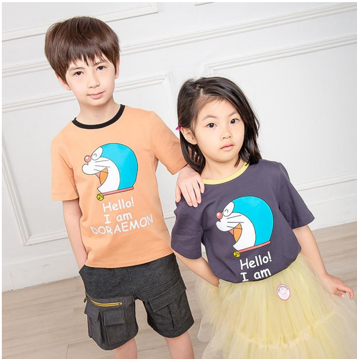
broadcute 播 时尚大片

“broadcute 播”是公司旗下童装品牌，创立于 2018 年。品牌面向 3-12 岁热爱自然和动物，以细腻感性和善良头脑向周围传播积极能量的“kids”。“broadcute 播”将当代和时尚相融合，在颜色、设计和印花中表现设计师的层次感，使用高质量的版型和材质，以干净、舒适、高级的外形获得父母和孩子们的青睐，传达爱心、善心、童心的品牌核心精神。