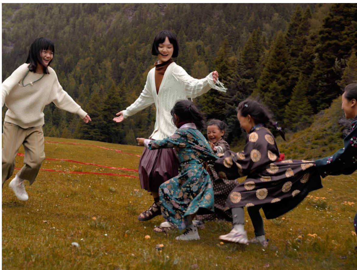
broadcast 播 时尚大片

我们正在经历的时代，无参照系可言。无论称之为后信息、后都市，还是后人类时代，这都是一个亟待回到原点，重新探索我们与周遭环境真实关系的关键性时刻。适逢品牌生长的新阶段，“broadcast 播”将有选择地把注意力拉回到身体，以此为探索我们内外世界与各种关系的路径，以游戏的心态去发现、感受、重生。触摸真实的需求，体验有质感的关系，允许生命本来的样子，在都市中，鲜活闪耀。