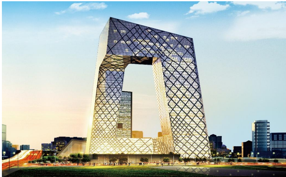
新中央电视台大剧院