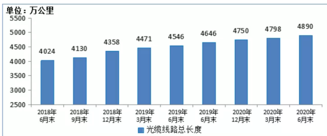
2018-2020 年 6 月末光缆线路总长度发展情况

2020 年上半年，整个通信行业第一季度受疫情影响比较明显，二季度各电信运营商投入及建设速度加快，三家基础电信企业前半年实现固定通信业务收入 2,363 亿元，同比增长 12%。移动电话用户规模保持稳定，4G 用户占比持续提升。截至 6 月末，三家基础电信企业的移动电话用户总数达 15.95 亿户，光缆线路总长度稳步增长，全国光缆线路总长度达到 4,890 万公里，同比增长 7.6%。增速较一季度提高 0.3 个百分点。其中接入网光缆、本地网中继光缆和长途光缆线路所占比重分别为 61.5%、36.2%和 2.3%。