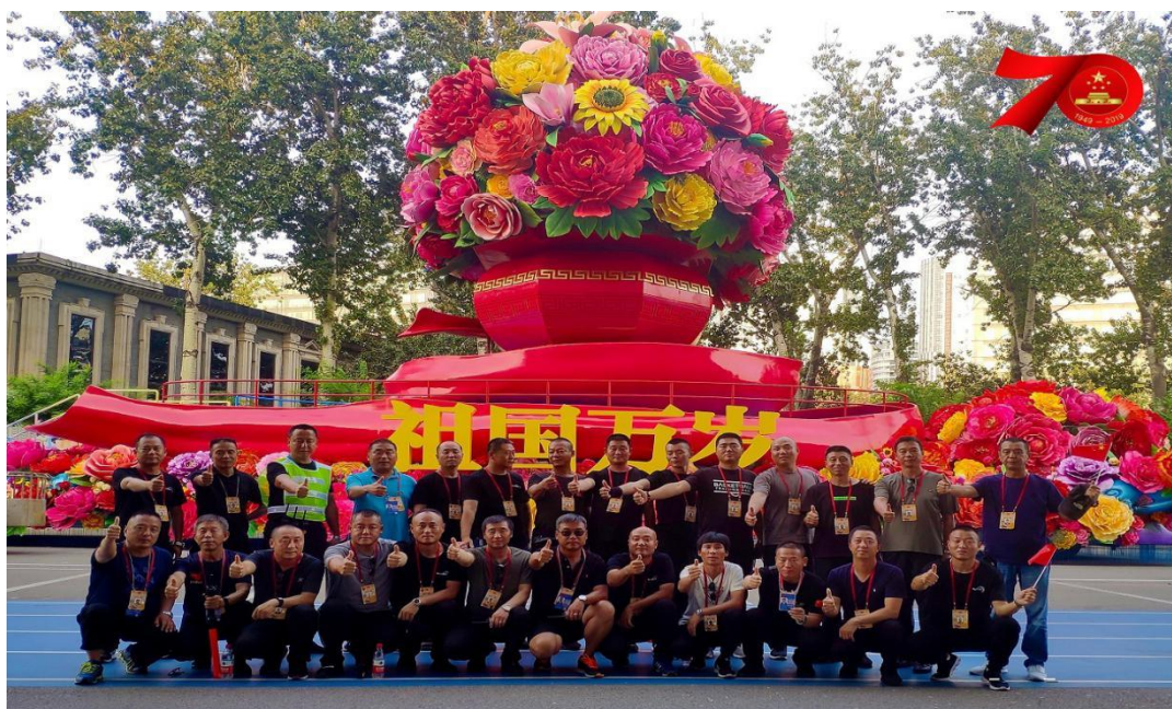
图为：东方时尚 70 周年国庆彩车指挥员（驾驶员）团队

在新中国成立 70 周年庆典活动中，我公司同 10 年前一样，再次被党和国家委以重任，承担并圆满完成了彩车驾驶员培训及高难度彩车驾驶的光荣政治任务。任务结束后，彩车团队组建了爱国主义宣讲团，分批走进东方时尚全国各子公司，结合“不忘初心，牢记使命”主题教育活动，将此次国庆彩车保障任务中所焕发出的爱国热情与尽责精神传递给更多的东方时尚人，公司凝聚力持续提高。