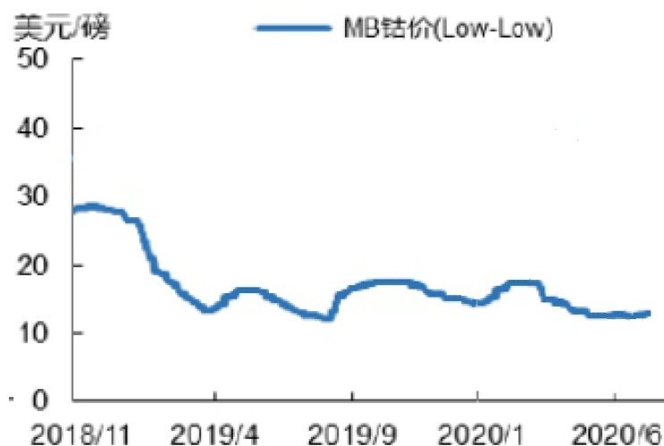
标准钴金属价格走势图 (美元/磅)

由于 2020 年 7 月份金属钴与钴盐价差已经缩窄, 电池终端需求正在逐步复苏, 预计下半年钴价格或止跌反弹。如海外疫情爆发影响到钴原料供应, 钴价或将存在大幅走高的可能。