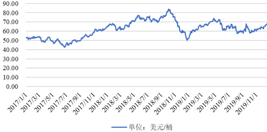
OPEC一揽子原油价格走势

粒料采购价格受石油等大宗商品及相关产品期货价格的影响较大，价格波动可能对公司的生产成本造成较大影响。报告期内，油价波动情况如下：