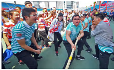
— 摄影作品：《顽强拼搏为行争光》合肥分行 潘晟