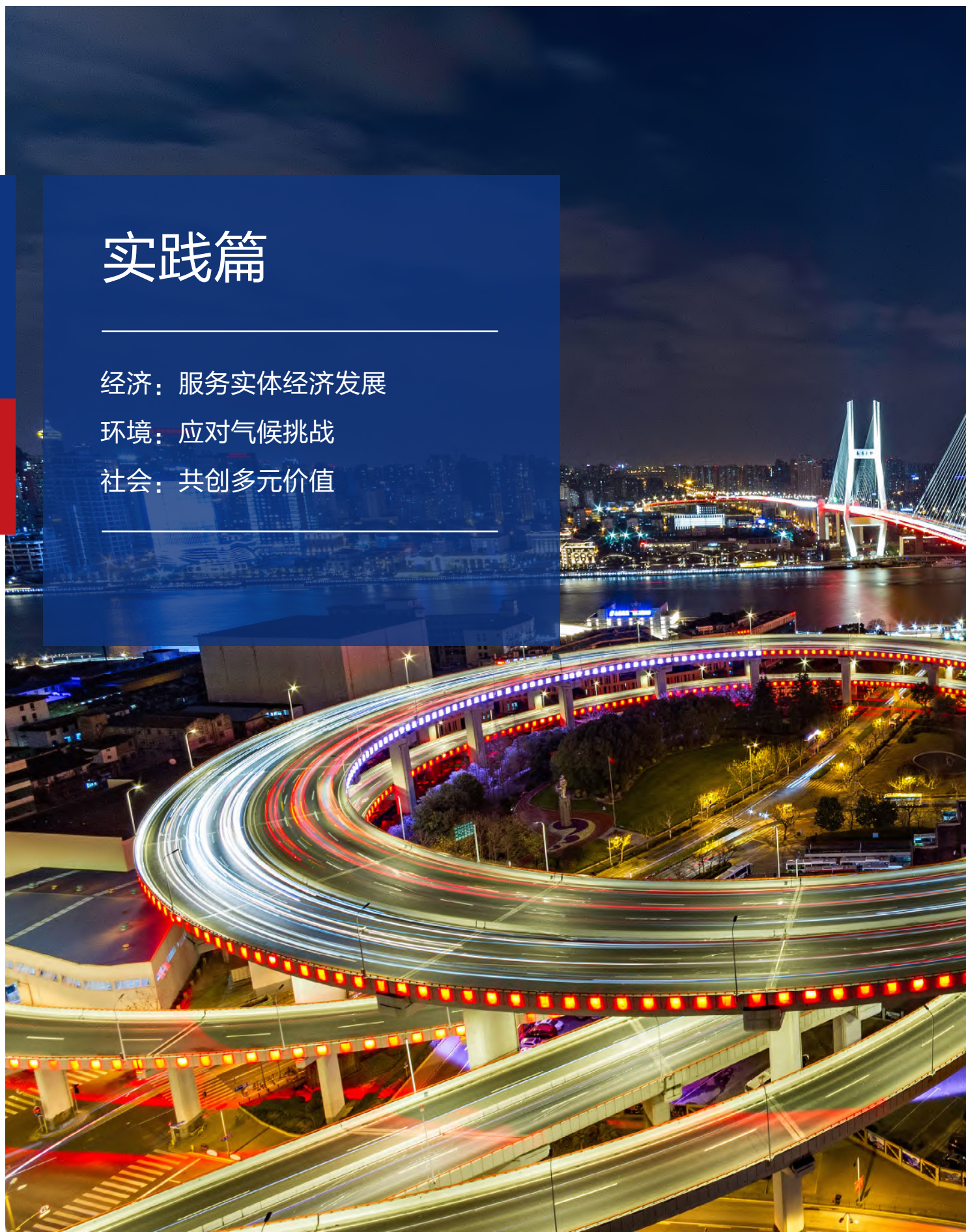
摄影作品：《美丽中国》总行信息科技部 李飞龙