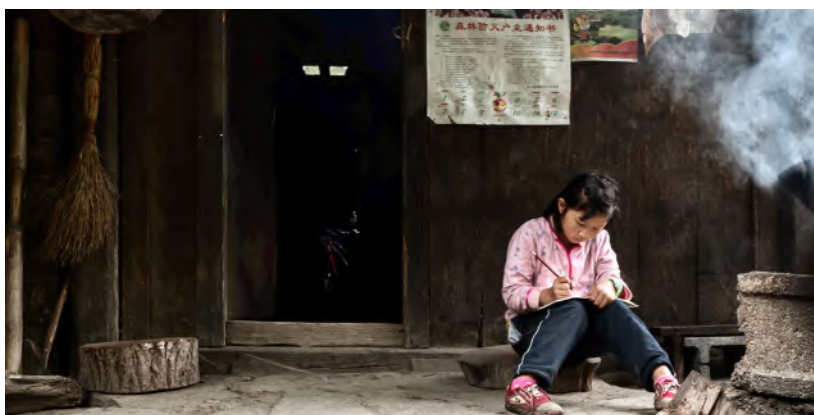
— 摄影作品：《专注》北京分行 倪亦文

2019年，上海信托首次将教育扶贫拓展到西藏地区，采用“走出去”和“请进来”两种方式，为西藏贫困地区教师提供专业化培训。出资100万元为四川宜宾市的各学校铺设远程教育设备，推动教育资源共享，扩大教育覆盖面。