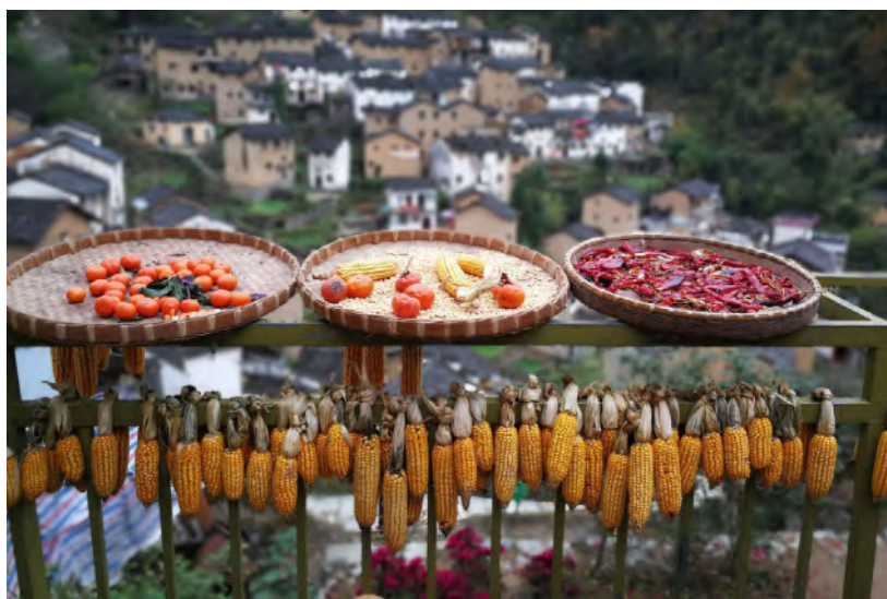
— 摄影作品：《晒》杭州分行 章勤

总行连续第二年推进落实上海市国资委“百企帮百村”结对扶贫工作任务，结对帮扶云南省文山市德厚镇亚拉冲村、东山乡南林村、薄竹镇五色冲村，并指导昆明分行落地执行，结合当地实际确定了“以产业开发扶贫为主，兼顾帮扶基础设施建设”的理念，通过机耕路建设、特色产业扶贫等项目的推进，定点扶贫成效初显。昆明分行荣获“云南省2019年脱贫攻坚奖扶贫先进集体”荣誉称号，是全省134个扶贫先进集体中唯一一家股份制商业银行。浦发银行定点扶贫工作获得了云南省委、省政府的充分肯定。