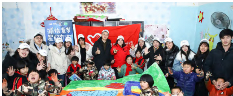
— 北京分行志愿者在北京光爱学校开展志愿者日活动