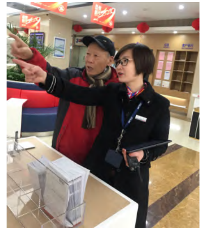
— 摄影作品：《最美浦发人》 南京分行 张欢

济南分行聊城分行成功上线农民工工资支付监管平台，为农民工提供优质高效的金融服务。平台集成成熟的考勤系统、先进的资金监管系统、工资代发系统于一体，将农民工工资清理和追缴变为及时预防和动态监管，形成制度完备、责任落实、监管有力的治理格局，让农民工吃上“定薪丸”。平台上线以来，聊城分行配备了专业的管理团队，开通了绿色服务通道，确保为农民工提供长期的专业化服务。