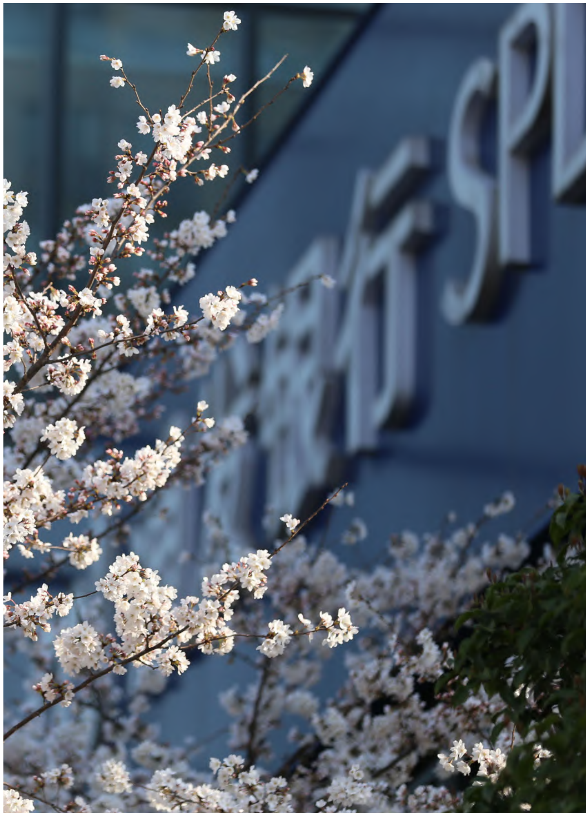
摄影作品：《樱之舞》苏州分行 顾维琪