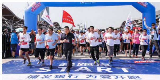
— 北京分行举办“为爱开跑”公益活动

“关爱自闭症儿童”系列公益活动，邀请全市二十余位自闭症儿童及其家长共同前往莫莉幻想儿童公园参加亲子活动，并送上浦发爱心礼物。