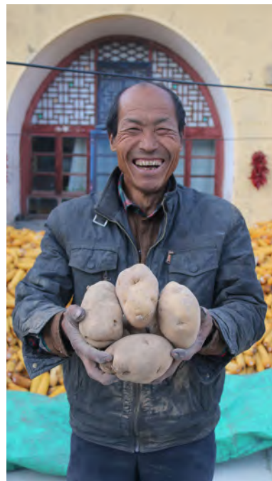
— 太原分行为忻州市保德县窑圪台乡助销土豆

积极参与各地“蓝天下的至爱”、希望工程等公益行动，共开展相关扶贫项目 12 项，投入资金 305.42 万元。