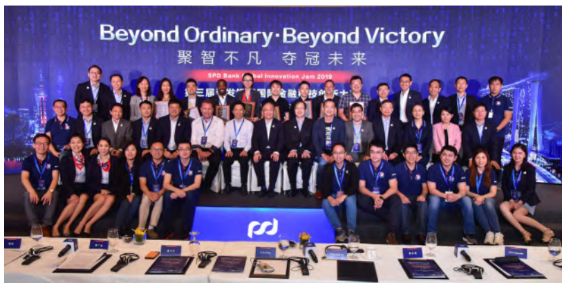
— 第三届国际金融科技创新大赛评委与参赛队伍代表合影

潜力的科技公司为合作对象，为银行服务突破固有定式、开拓无限创新金融服务和产品、推进“金融服务”向“泛金融服务”演进提供更多可能，同时选拔并培育具有世界影响力的科技公司。