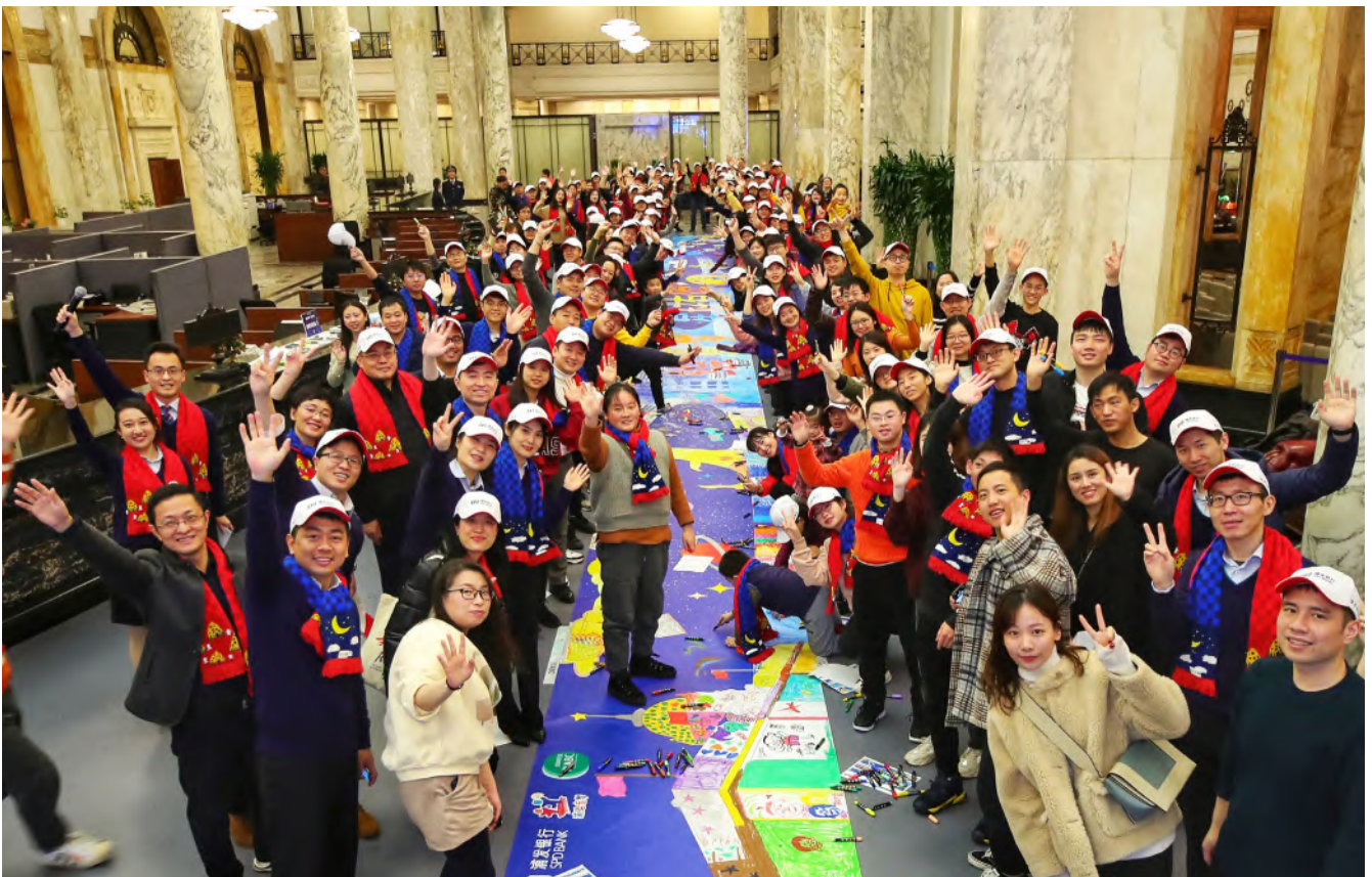
总行、子公司 150 余名志愿者在上海外滩 12 号大楼开展第十三次全行志愿者日活动