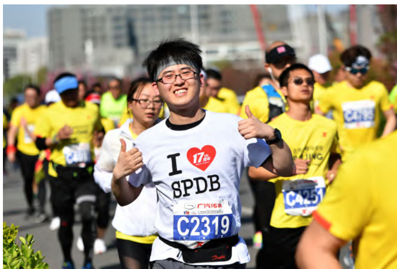
— 摄影作品：《逐梦奔跑进取不息》天津分行 张坤

在第109个“三八”国际劳动妇女节期间，由总行女工委牵头，在世纪公园组织近700名员工参与“春暖浦发相约依旧”健步走活动。各级工会成立文体活动俱乐部，适应员工多元化的需求，开展健身、学习、展示才艺等活动，覆盖各层级员工5万余人。开展全行“职工之家”评选，上海陆家嘴支行等58家基层工会单位被评为浦发先进职工之家。南宁分行工会、上海国际信托公司工会、上海分行办公室工会小组、信用卡中心信贷运营部工会小组荣获“上海金融系统先进职工之（小）家”荣誉称号。