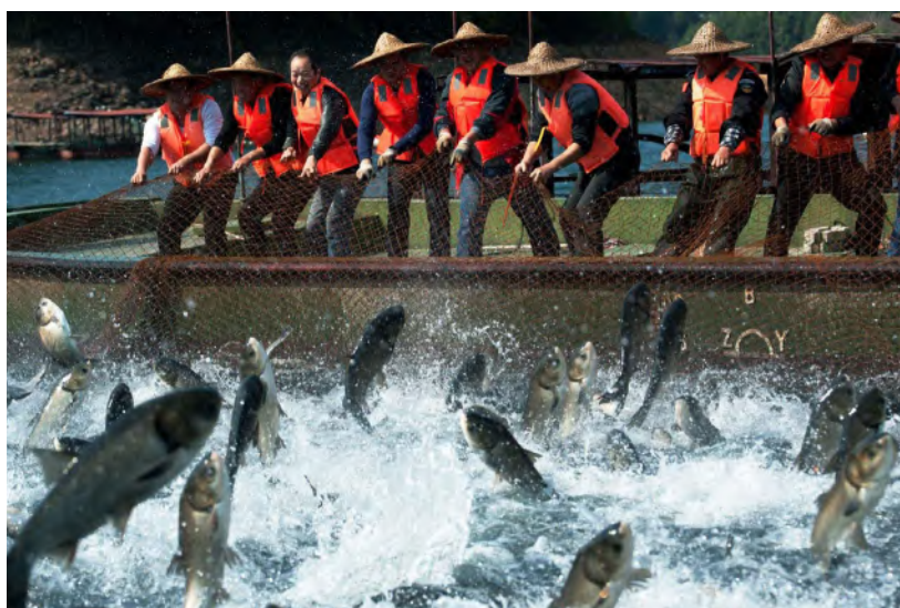
— 摄影作品：《鱼跃》南京分行 石洁