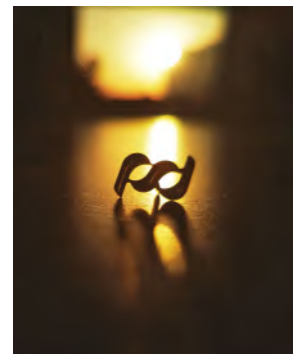
— 摄影作品：《办公室的夕阳》宁波分行 周瀚

有市场竞争力的薪酬待遇，按时缴纳各类法定保险，建立系统化的健康保障体系，包括工伤保险、补充医疗保险及补充养老保险（年金）等。