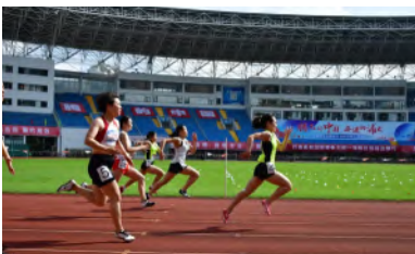
— 女子短跑比赛现场