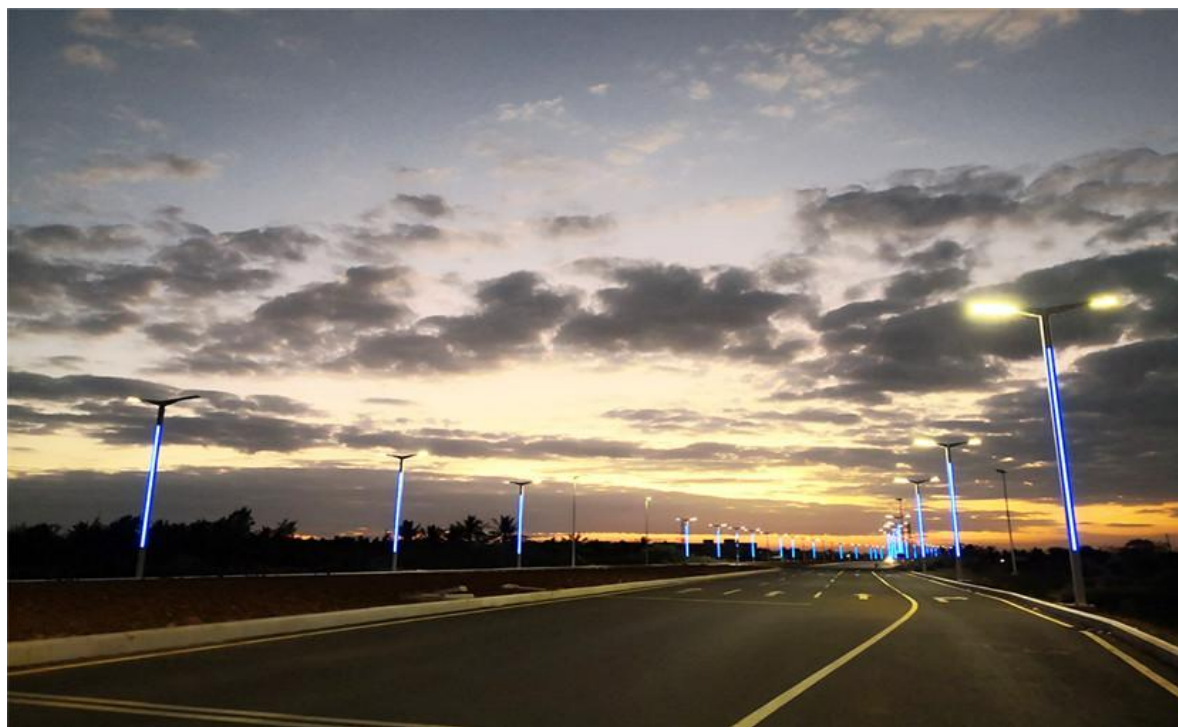
“峰飞”海口江东大道

城市照明工程属于城市基础设施建设，是由国家投资的公共设施建设的一部分。国家城市道路建设的投入对城市照明行业的市场变化趋势有重要影响，而城市道路建设长度及面积将会直接决定城市照明的市场需求。近些年来，随着国家对于道路建设的持续投入，我国城市年末实有道路长度和面积已连续多年增加，这直接带动了每年城市道路照明路灯数量的增加。与此同时，随着城市车辆与人口的增加，越来越多的城市进行大规模道路拓宽改造工程，并进行城市风貌改善，以提升城市景观品味。城市照明作为彰显城市文化特征、改善人民居住环境的重要手段，将随着城市道路的建设获得更大的发展。借此发展良机，公司将文化定制的理念嵌入到城市道路照明产品当中，将最能代表地域文化和人文环境的元素恰当地运用在工业化的照明产品之中，最大限度地满足不同地域客户对当地文化的需要。公司在城市文化照明产品的独特设计使公司在文化定制的道路上走在了行业前列，并已形成品牌优势，成为行业中文化定制的领军者。