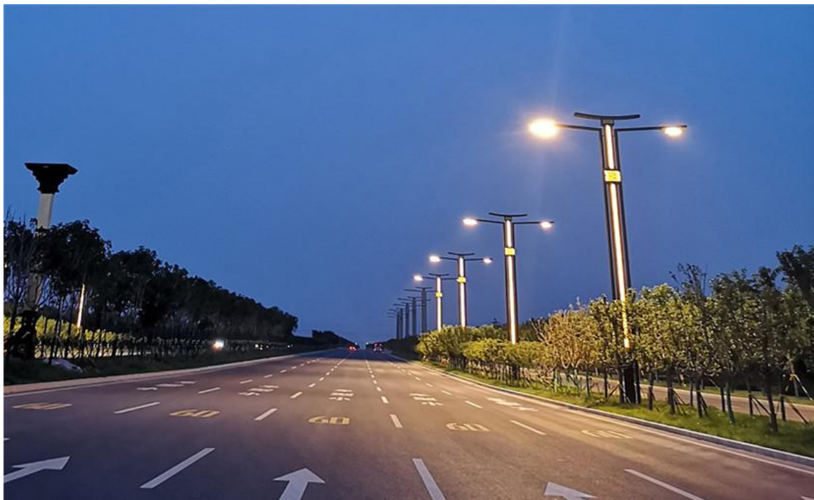
“帝王冠”亮相西安沣泾大道