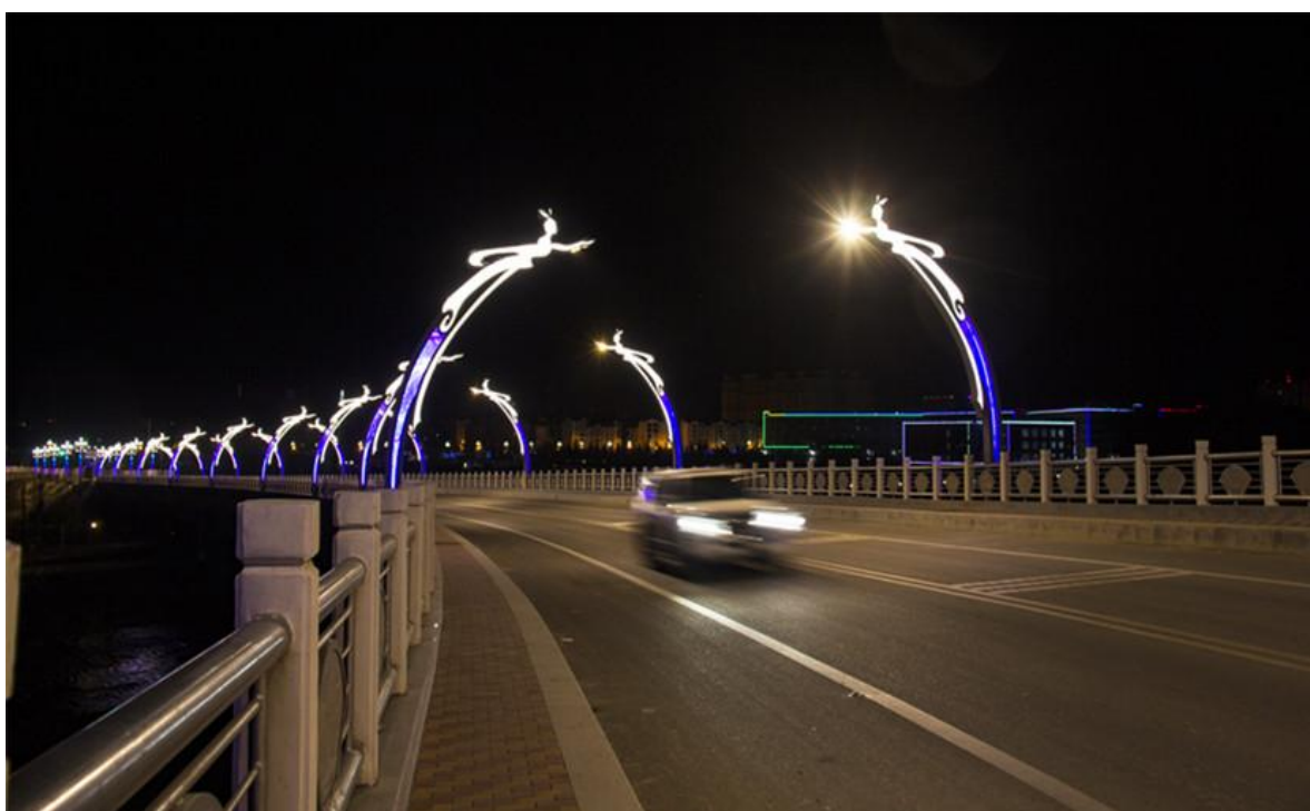
文化照明点亮多彩冕宁