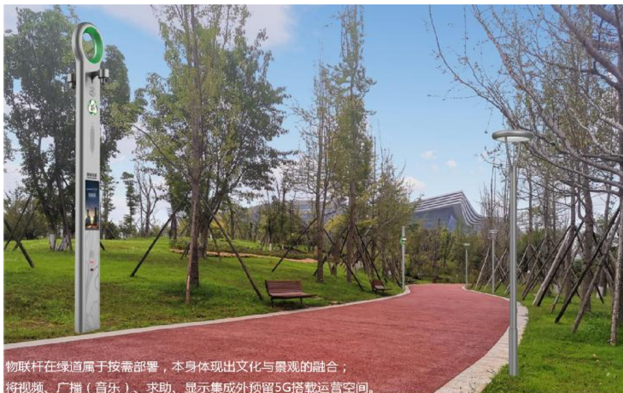
物联杆在绿道属于按需部署，本身体现出文化与景观的融合； 将视频、广播（音乐）、求助、显示集成外预留5G搭载运营空间。

成都市“锦城智慧绿道”项目，该项目将利用自身的互联网科技和运营能力，推动成都市智慧城市建设，助力成都绿道新经济的发展，实现绿道体系的可持续运营。