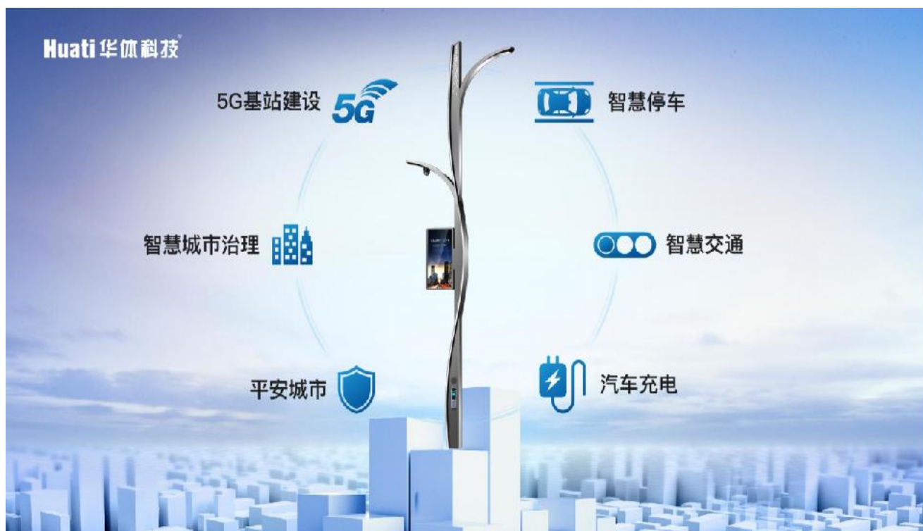
智慧路灯场景服务