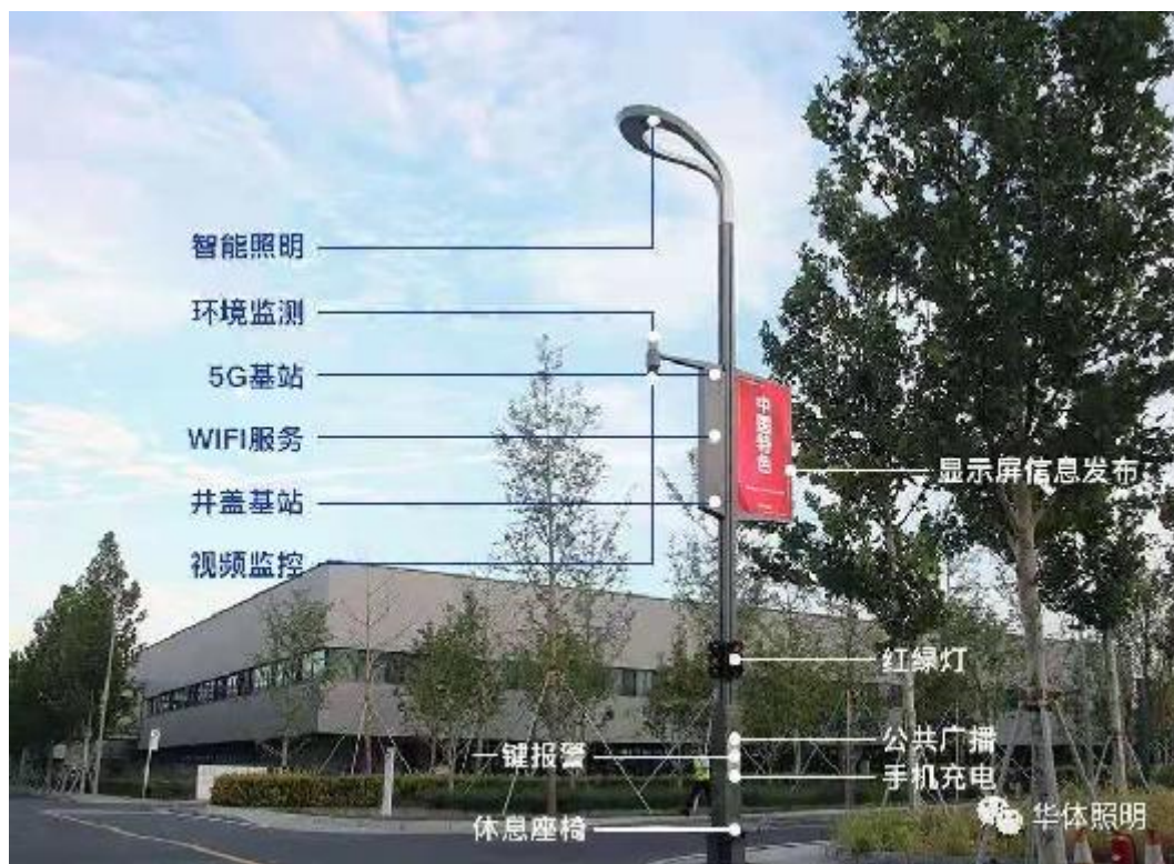
雄安市民服务中心

成都市“锦城智慧绿道”项目，该项目将利用自身的互联网科技和运营能力，推动成都市智慧城市建设，助力成都绿道新经济的发展，实现绿道体系的可持续运营。