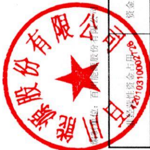
百川能源股份有限公司2019年度非经营性资金占用及其他关联资金往来情况汇总表