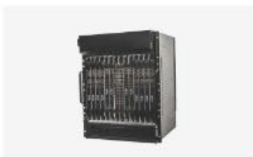
接入汇聚与集群软交换设备