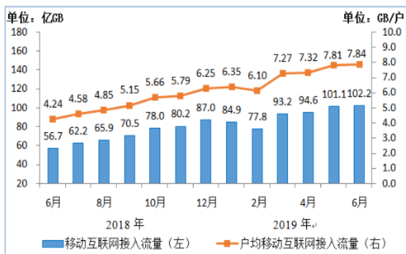
图 1：移动互联网接入月流量及户均流量增长情况

随着移动互联网业务的创新拓展，带动移动支付、移动出行、移动视频直播、餐饮外卖等应用加快普及，刺激移动互联网接入流量保持高速增长。2019 年上半年度，移动互联网累计流量达 554 亿 GB，同比增速达 107.3%；其中通过手机上网的流量达到 552 亿 GB，占移动互联网总流量的 99.6%，同比增速达 110.2%。2019 年 6 月当月，户均移动互联网接入流量(DOU)达到 7.84GB，同比增速达 85%（图 1）。（数据来源于中华人民共和国工业和信息化部网站：《2019 年上半年通信业经济运行情况》）