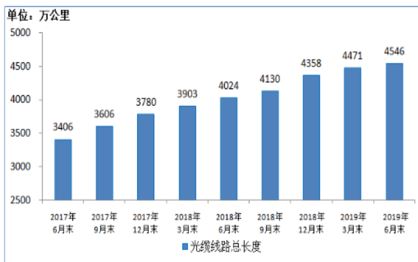
图 2：2017 年 6 月-2019 年 6 月光缆线路总长度发展情况